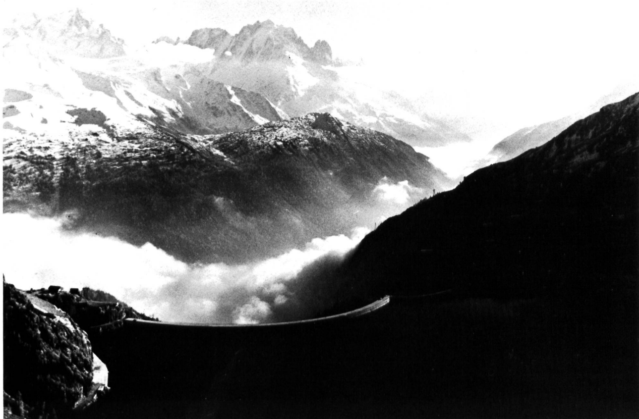
Bild 1. Staumauer und Stausee Emosson, Ansicht von der Wasserseite mit Panorama auf das Montblancmassiv.

Anschliessend folgten die Verhandlungen für die schweizerisch-französischen Staatsverträge, die 1963 unterzeichnet wurden. Sie erlaubten die Ausarbeitung einer schweizerischen und einer französischen Wasserrechtskonzession, die am 1. Februar 1967 in Kraft traten. Am 19. April