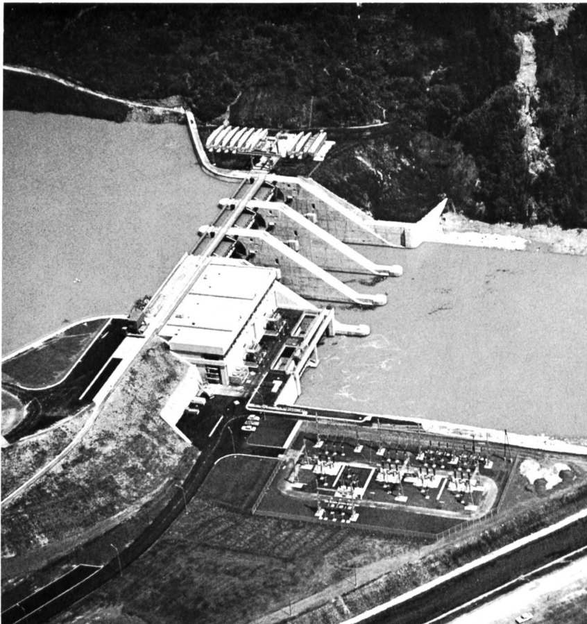
Bild 1. Wehranlage und Kraftstation des Draukraftwerkes Ferlach-Maria Rain.

Ferlach-Maria Rain ist die dritte Stufe der sogenannten «Mittleren Drau». Das Hauptbauwerk, auf konglomeratartige, dicht gelagerte Schotter gegründet, besteht aus einem Krafthaus mit 2 Maschinensätzen (fünfflügelige Kaplan-turbinen mit je 39 MW Nennleistung bei 20,8 m Fallhöhe und 220 m 3 /s Durchfluss, Drehstrom-Synchrongeneratoren mit je 50 MVA Nennleistung, 125 U/min) und einem dreifeldrigen Wehr für 3300 m 3 /s Hochwasserdurchfluss. Die 15 m breiten Wehrfelder werden durch 12,8 m hohe Segmentschützen mit 4,2 m hohen, aufgesetzten Klappen verschlossen. Der 16 m hohe, steile Absturz von der Wehrschwelle zur gegeneigenen Tosbeckensohle legte es nahe, die gesamte Wehrsohle als dickwandiges, monolithisches Fallwerk auszubilden, auf das die 40 m hohen Wehrpfeiler aufgesetzt sind. Die Maschinenblöcke sind ab der Sohlplatte durch die üblichen Fugen getrennt. Bodenpressung und Sohlwasserdruck werden an zahlreichen Messstellen überwacht; eine Dichtungswand oder ein Injektions-schirm erübrigt sich. Betoniert wurde mit einem Sonderzement, der 30 % Flugasche aus einem Dampfkraftwerk des Bauherrn enthält und der auch bei dessen zurzeit im Bau befindlichen Talsperre Kölnbrein (1,6 Mio m 3 ) zum Einsatz kommt.