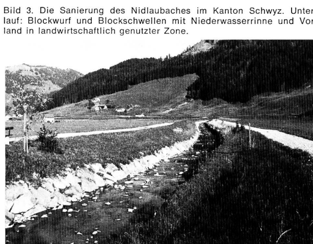
Bild 3. Die Sanierung des Nidlaubaches im Kanton Schwyz. Unterlauf: Blockwurf und Blockschwellen mit Niederwasserrinne und Vorland in landwirtschaftlich genutzter Zone.