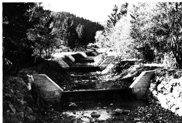
Bild 2. Die Sanierung des Nidlaubaches im Kanton Schwyz. Mittellauf: Leichte Abtreppung mit Eisenbetonschwellen, Blockwurf, Bepflanzung und beidseitigen Unterhaltswegen.