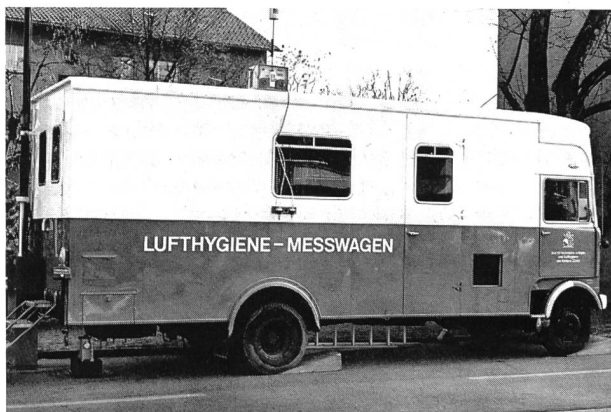
Bild 1. Mit dem Lufthygiene-Messwagen werden die wichtigsten Schadstoffe Schwefeldioxid, Stickstoffoxide, Kohlenmonoxid, Kohlenwasserstoffe, Staub und Blei wie auch die meteorologischen Daten Tag und Nacht gemessen und registriert.

Es erwies sich daher als notwendig, in Ergänzung des vorliegenden Rahmenprogramms zur Lärmbekämpfung an Strassen einen geeigneten Massnahmenkatalog zur Abwehr von Luftverschmutzungsimmissionen entlang Strassen auszuarbeiten.