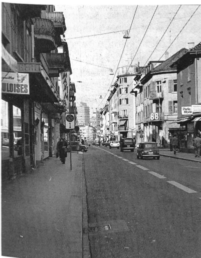
Bild 4, links. Bei hohem Verkehrsaufkommen werden die Verkehrsabgase, infolge der beidseitigen engen Bebauung gefangen gehalten und ungenügend ventiliert.

Sie dienen in erster Linie der Sanierung bereits prekärer Situationen. Diese finden sich am häufigsten in eng bebauten Strassen«schluchten» und zwar schon bei niedrigen Frequenzen. Stillstehender Verkehr und Schritttempo sind zu vermeiden. Die Wirksamkeit behördlicher Massnahmen hängt aber häufig von der vernünftigen Mitwirkung jedes einzelnen Fahrers ab (Motor abstellen). Das Hauptgewicht für behördliche Massnahmen liegt bei der flüssigen Gestaltung des Verkehrsablaufes.