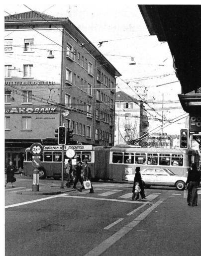
Bild 5, rechts. Zur Verflüssigung des Verkehrs müsste, wo nicht vorhanden, die Einführung der Gelbphase vor Rot geprüft werden.