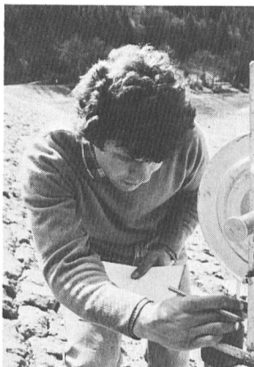
Bilder 1 und 2, links und Mitte. Wöchentlich werden Piezometermessungen durchgeführt. Bild 3, rechts. Beim Ablesen und Eintragen der verschiedenen Messwerte und Daten

Ce problème est doublement important. Premièrement, parce que le fait de savoir que le problème des remplaçants est clairement réglé soulage les personnes impliquées dans l'organisation, en ce sens qu'elles savent que les contrôles continueront normalement pendant leur absence éventuelle et notamment pendant l'absence d'un gardien (par exemple, pour cause de vacances, de service militaire, accidents ou de maladie). Deuxièmement, parce qu'un choix judicieux de remplaçants devrait aider à résoudre le problème très important de la relève du gardien, quand celui-ci