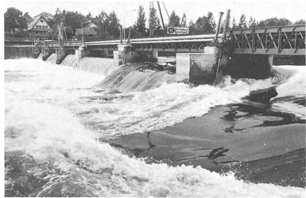
Bild 1. Ansicht des umgebauten Wehres von der Unterwasserseite her. Im Vordergrund die drei hydraulisch betätigten Wehrklappen in unterschiedlicher Öffnungsstellung. Die drei Wehrröffnungen im Hintergrund besitzen nach wie vor die alte Schleusenausrüstung.

Schwachstellen in der Foundation des Maschinenhauses sowie der allgemeine technische Zustand und die umständliche Bedienung waren zu Beginn der siebziger Jahre Gegenstand eingehender Untersuchungen. Entsprechende Massnahmen drängten sich auf. Im Hinblick auf das Alter der Gesamtanlage sowie den nahen Heimfalltermin liess sich jedoch nur eine Lösung wirtschaftlich rechtfertigen, die gleichzeitig eine wesentliche Rationalisierung ver-