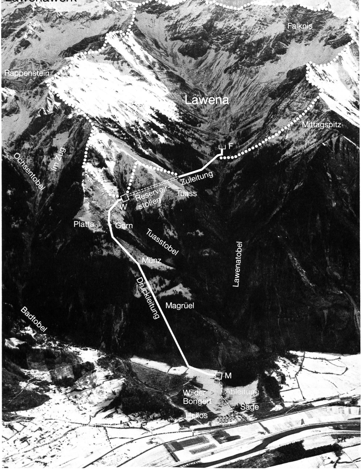
Bild 3. Übersicht über das Lawenawerk. F = Fassungen Lawena, ca. 1400 m ü.M.; W = Wasserschloss und Apparatekammer, 1380 m ü.M.; M = Maschinenhaus, 500 m ü.M.; ○○○○ Einzugsgebiet.