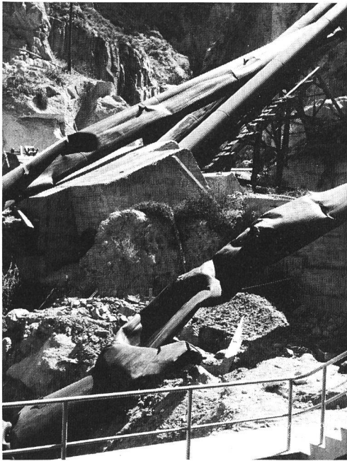
Bilder 3 und 4. Schwere Havarie einer zweisträngigen Druckleitung infolge eines unzulässig hohen Druckstosses, verursacht durch einen unkorrekt schliessenden Kugelschieber. Eine Zustandsbeurteilung, die auch die Beanspruchung von seiten der übrigen Systemkomponenten erfasst, kann solche Ereignisse verhindern.