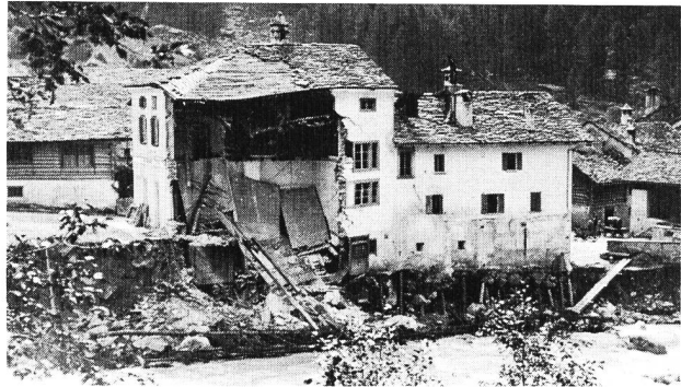
Bild 2. Zerstörte Häuser in Stampa, 1927.