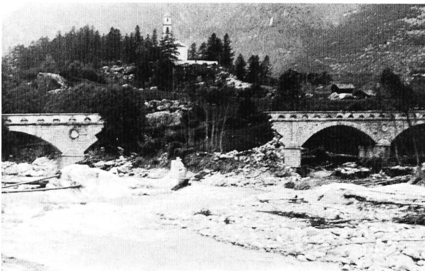
Bild 1. Zerstörte Strassenbrücke über die Maira unterhalb Stampa, 1927.

Die in der Folge des 1927er Hochwassers in den Jahren 1930/32 an der Sperrstelle der heutigen Albigna-Mauer er-