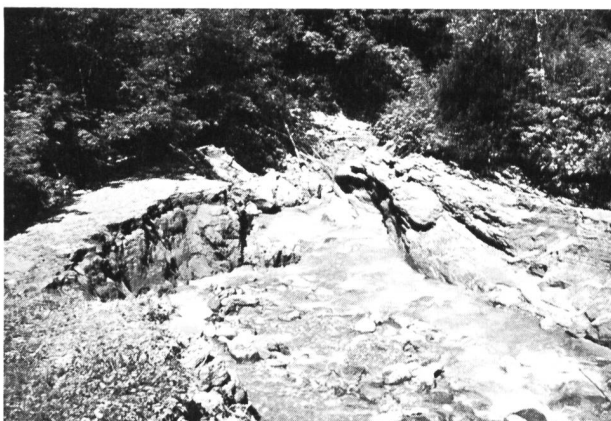
Bild 3. Aufräumarbeiten im Oberwasser der linken Durchlassöffnung des Wehres Lünen (Juli 1987).

Nun schlossen wir den mittleren und rechten Schütz. Mit Hilfe eines grossen Habeggers gelang es uns, eine kleinere Tanne, die sich neben unserem «Sorgenkind» befand, zu lösen. Endlich wurde der Weg für das Wasser frei! Der Wasserdruck auf den Wurzelstock wurde so gross, dass es diesen mitriss und die Sicherung dieses Baumrestes den angreifenden Kräften nicht mehr gewachsen war. Mit einem starken Knall wurden die zwei 14 mm dicken Stahlseile zerrissen. Ein weiteres Habeggerseil und eine Umlenkrolle wurden ebenfalls zerstört.