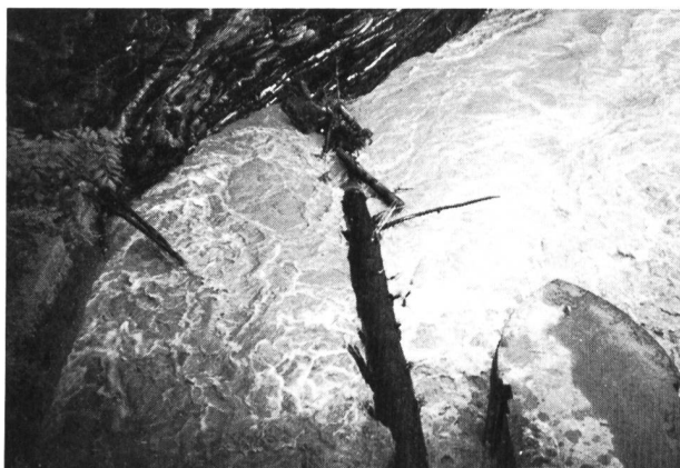
Bild 2. Blick vom Wehr des Kraftwerkes Lünen flussabwärts. Die in der Durchlassöffnung verkeilte Tanne war etwa 20 m lang, der Stamm hatte 70 cm Durchmesser (Juli 1987).

Aber die Plessur brachte immer wieder neues Holz angeschwemmt und blockierte so immer stärker das Wehr in Lünen. Eine 20 m lange Tanne hatte sich zudem im linken Schütz und am linken Felsufer so verklemmt, dass wir mit unseren kleinen Habeggern und den sonstigen Hilfsmitteln nicht mehr in der Lage waren, weiter zu räumen. Ziemlich betroffen mussten wir am Abend feststellen, dass unsere Bemühungen umsonst gewesen waren, es war kein Erfolg zu sehen. Wir waren gezwungen, eine Unternehmung mit geeigneten Hilfsmitteln anzufordern – während der Sommerferien kein leichtes Unterfangen. Die Firma Lazzarini war dann in der Lage, uns mit 4 Arbeitern und entsprechendem Material zu Hilfe zu kommen. Auch der Bauführer musste erkennen, dass die gestellte Aufgabe schwer zu erfüllen war. Die eingeklemmte Tanne war der «Dreh- und Angelpunkt» für einen Erfolg unserer Arbeit. Mit 4 Habeggern begannen wir die Tanne zu lösen. Zuerst wurde der Baumstamm gesichert und in der Mitte zersägt. Doch auch dies brachte uns keinen Erfolg! Der Wurzelstock, er hatte einen Durchmesser von etwa 3 m, hatte sich durch den Wasserdruck in der Durchlassöffnung verklemmt.