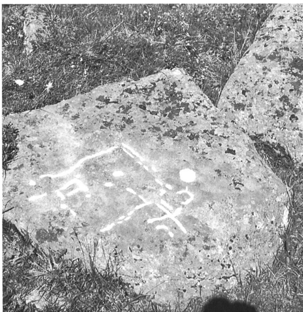
Bild 3. Obersaxen: Quadratstein, die Seiten des Vierecks liegen N-S bzw. O-W. Er ist Teil einer astronomisch gerichteten Megalithanlage.

Die Forschungsergebnisse der letzten Jahre erhärten immer mehr eine zeitliche Einstufung der meisten Steinset-