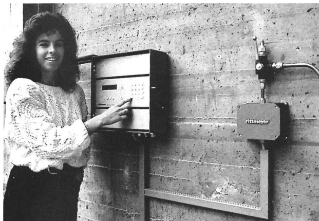
Bild 5. Füllstandsmessung eines Stausees mit dem Präzisionsdruckmessgerät W1Q.

Erdbeschleunigung g . Der Formalismus, der zur korrekten Wasserstandsmessung führt, ist gegeben durch: