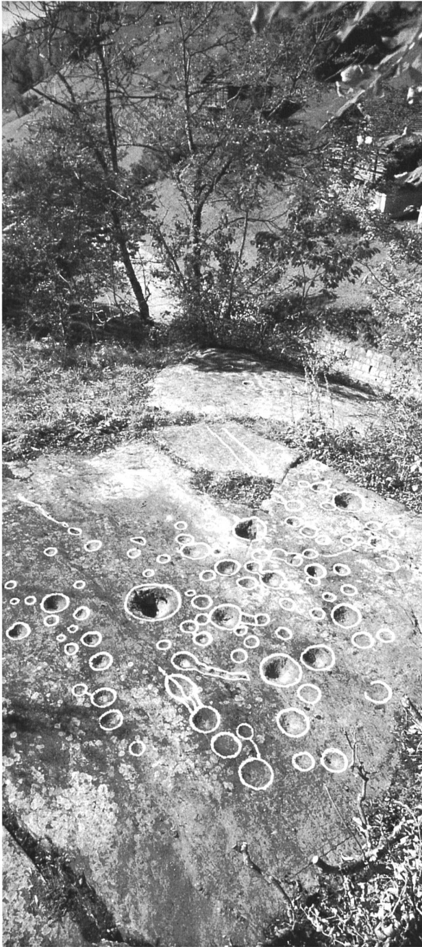
Bild 1. Breil/Crep Patnasa: Bedeutendster Schalenstein der Surselva mit über 120 Schalen. Lage oberhalb der Rheinbrücke von Tavanasa nach Danis.

Vor mehr als 6000 Jahren wurde in der Mittelsteinzeit der Jäger und Sammler der Altsteinzeit durch den sesshaften Ackerbauern und Viehzüchter abgelöst. Damit stieg die Abhängigkeit des Menschen von den klimatischen Gegebenheiten im Jahresverlauf, was ihn zur Schaffung eines Kalenders zwang. Mittels Steinsetzungen und durch geschickte Anordnung von Schalen und anderen Felsgravuren auf Steinblöcken und markanten Felsen wurden nun wichtige Daten des Sonnenjahres durch Beobachtung von Sonnenauf- und -untergängen am Horizont festgehalten sowie die Haupthimmelsrichtungen festgelegt. Die astrono-