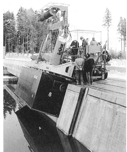
Bild 2, rechts, zeigt den Krane beim Einsetzen eines Dammbalkens.