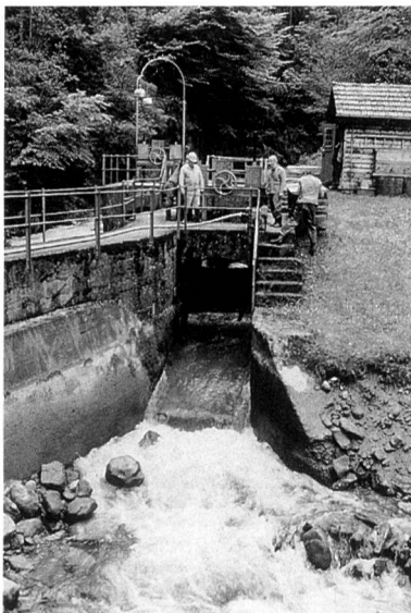
Bild 1. Der Wehreinlauf.

«unter uns», die Hauszeitung der industriellen Betriebe der Stadt Chur, hat im Heft 3/1996 darüber berichtet; gerne geben wir die Information auch den Lesern von «wasser, energie, luft» weiter.