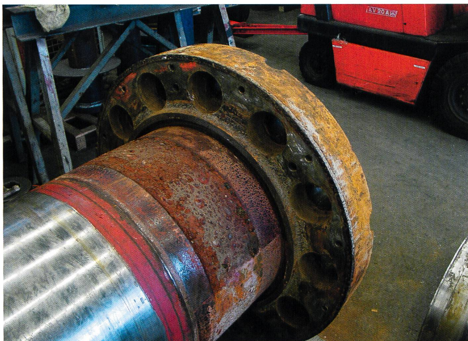
Bild 1. Ansicht der Turbinenwelle, Turbinenseite mit Flansch zur Laufradbefestigung.

Um eine weitere bzw. erneute Wasserstoffversprödung zu verhindern, wird der Radius zum Flansch trockengelegt, mit einem korrosionsbeständigen Abdeckring. Der Leerraum im Radius wird mit Fett aufgefüllt und somit einer Berührung mit Wasser entgegengewirkt.