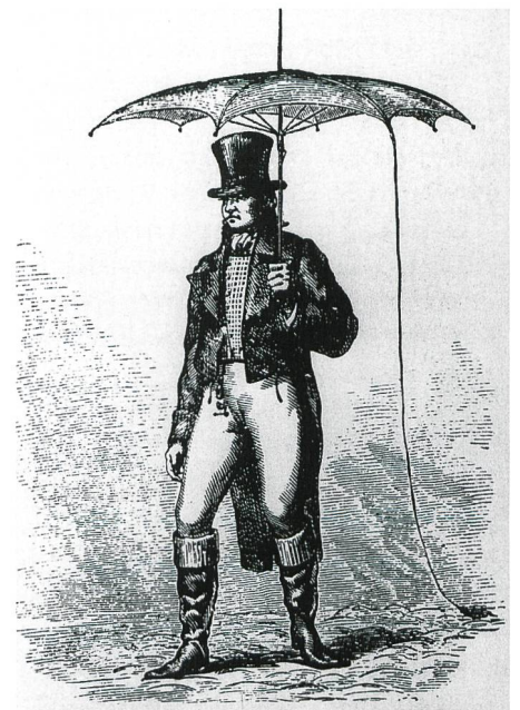
Bild 4. Blitzschutz ist ein altes Thema und wurde zu allen Zeiten anders gelöst, nicht immer optimal...

Fast alle Blitzzunfälle ereignen sich im Freien. Der Blitz schlägt vornehmlich an Stellen ein,