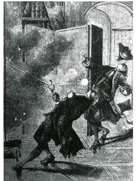
Bild 3. Tödlicher Unfall durch Blitzschlag von Professor G. W. Richmann in Petersburg im Jahre 1753, als er während eines Gewitters experimentierte.