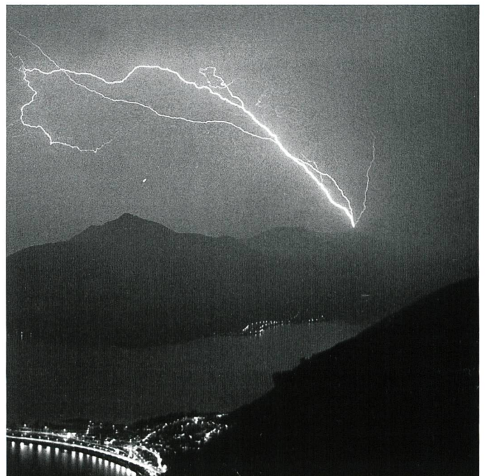
Bild 6. Typischer Aufwärtsblitz, nach oben verzweigt, aufgenommen vom San Salvatore aus; im Vordergrund der Damm von Melide.