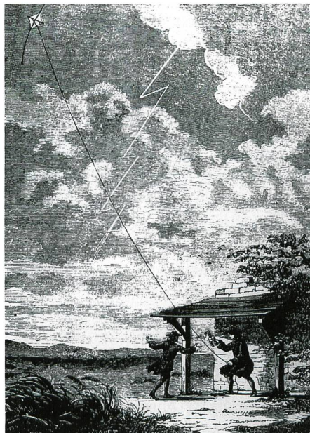
Bild 2. Das berühmt gewordene Drachenexperiment, mit welchem es Benjamin Franklin 1752 in Philadelphia erstmals gelang, Elektrizität in der Atmosphäre nachzuweisen.