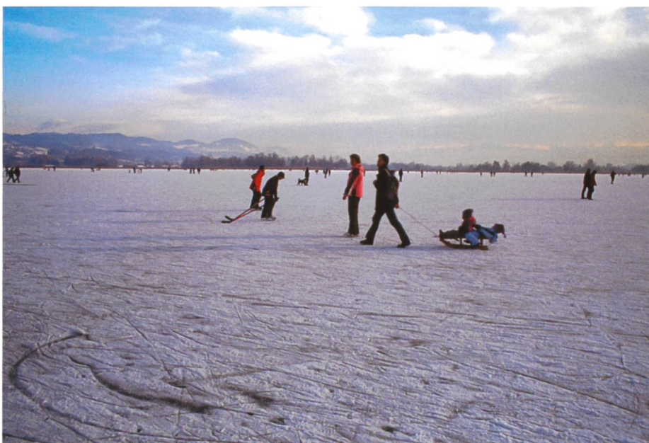
Bild 7. Das Kältehoch brachte gefrorene Gewässer und grosse Trockenheit. Auf dem gefrorenen Pfäffikersee (3 km 2 ) tummeln sich viele Leute.

Diese Temperaturschwankungen sind jeweils im gesamten nordatlantischen Bereich – auf der europäischen und auf der nordamerikanischen Seite – zu beobachten. In den letzten Jahren hatten wir vermehrt kältere Winter, als z.B. im letzten Jahrzehnt des 20. Jahrhunderts – offenbar sind wir wieder in einer negativen NAO-Phase. So hat uns ein lang andauerndes Kältehoch tiefe Temperaturen und eine grosse Trockenheit beschert.