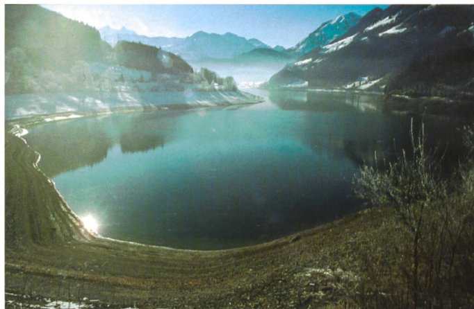
Bild 6. Die Stauseen sind Ende Winter noch leerer als sie es zu dieser Zeit ohnehin sind. Im Bild der Lungernsee OW.

sichtbar. In Stein am Rhein konnte man zu dieser Zeit zu Fuss die Insel «Werd» erreichen. Trotz der starken Regenfälle, die in der Innerschweiz im August 2005 grossräumige Überschwemmungen verursachten, kam der Bodensee damals gerade einmal auf eine durchschnittliche Wasserhöhe. Das fehlende Wasser geht letztlich auf den heissen und trockenen Jahrhundertssommer 2003 zurück. Dieser Wasserrückstand macht sich bis heute markant bemerkbar.