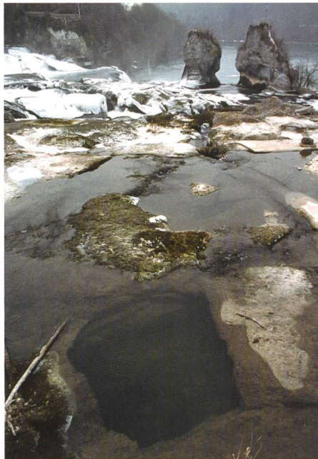
Bild 8. Vom tosenden Rheinfluss ist nicht mehr viel übrig.

Ein solches Kältehoch hält uns jedoch auch die Winterstürme vom Leib, weil es sich wie ein Schutzwall zwischen Europa und den Atlantik schiebt und damit die von Westen kommenden Luftmassen und die Sturmtiefs blockiert und ablenkt. Wenn sich dieses Hoch zurückzieht, befinden wir uns plötzlich in einer Übergangszone zwischen Hoch und Tief, wo der Druckunterschied und damit die Windgeschwindigkeit am grössten ist.