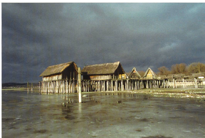
Bild 4. Die Pfahlbauten in Unteruhldingen (D) stehen nicht mehr im Wasser.