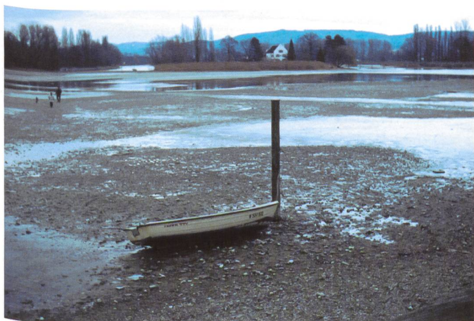
Bild 3. In Stein am Rhein kann man zu Fuss die Insel «Werd» erreichen.