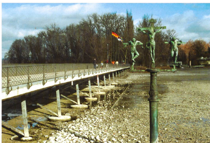
Bild 2. Die Mainau ist keine Insel mehr.