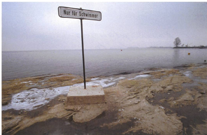
Bild 5. Das Strandbad bei Rorschach ist trockengelegt.