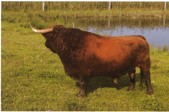
Bild 12. Schottische Hochlandrinder übernehmen die Pflege und sorgen dafür, dass die Schutzgebiete nicht betreten werden. Einem solchen Bullen will kein Störenfried begegnen.