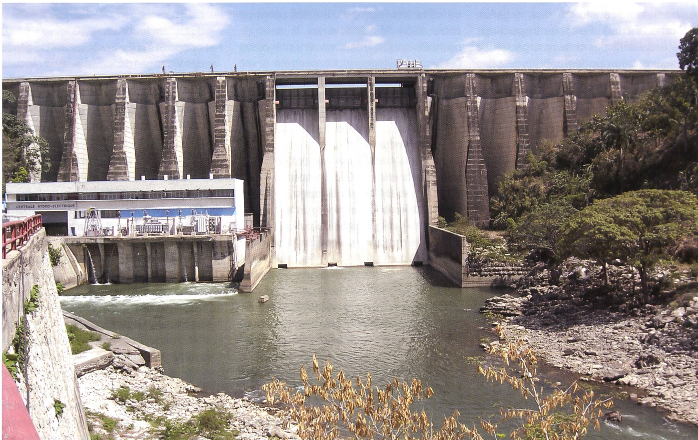
Figure 2. Vue de l'aval du barrage de Péligré.