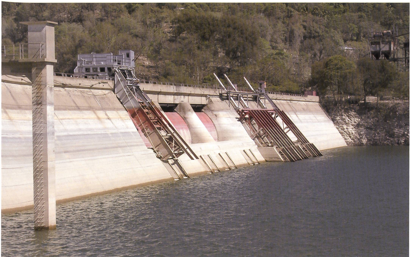
Figure 3. Tour du limnimètre, évacuateur de crue et organes hydromécaniques des vidanges de fond et des prises usinières.