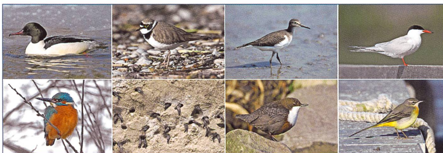
Bild 1. Typische aktuelle und ehemalige Brutvögel an Fliessgewässern im Kanton Zürich, welche ökologisch sehr eng an den Lebensraum Fliessgewässer gebunden sind. Von links oben nach rechts unten: Gänsesäger, Flussregenpfeifer, Flussuferläufer, Flusseeeschwalbe, Eisvogel, Uferschwalbe, Wasseramsel, Bergstelze.

Von den 139 aktuellen Brutvogelarten des Kantons Zürich kommen 38 Arten (27%) bevorzugt oder ausschliesslich in der Nähe von Fliessgewässern vor (Tabelle 1; nachfolgend «Leitarten Fliessgewässer» genannt). Grundlage für diese Erkenntnis ist eine flächendeckende Analyse der geografischen Verteilung von Brutvogelrevieren aus dem Zürcher Brutvogelatlas 2008 (Weggler u.a. 2009). Die Bindung dieser Arten an Fliessgewässer ist unterschiedlich eng. Vier Arten brüten im Kanton Zürich aktuell praktisch ausschliesslich an Fliessgewässern, nämlich Gänsesäger, Eisvogel, Wasseramsel und Bergstelze. Weitere ökologisch sehr eng an Fliessgewässer gebundene Arten sind entweder vollständig verschwunden (Flussuferläufer) oder haben sekundäre Ersatzlebensräume bezogen: Die Flusseeeschwalbe brütet im Kanton Zürich nur noch auf künstlichen Brutplattformen am Greifen- und Pfäffikersee, die Uferschwalbe und der Flussregenpfeifer brüten heutzutage überwiegend in anthropogen geschaffe-