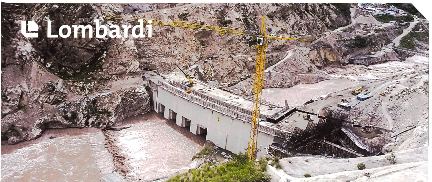
Cerro del Aguila, Rio Mantaro, Peru

HYDROGRAPHIE | STRÖMUNGSMESSUNG | SEEGRUNDKARTIERUNG