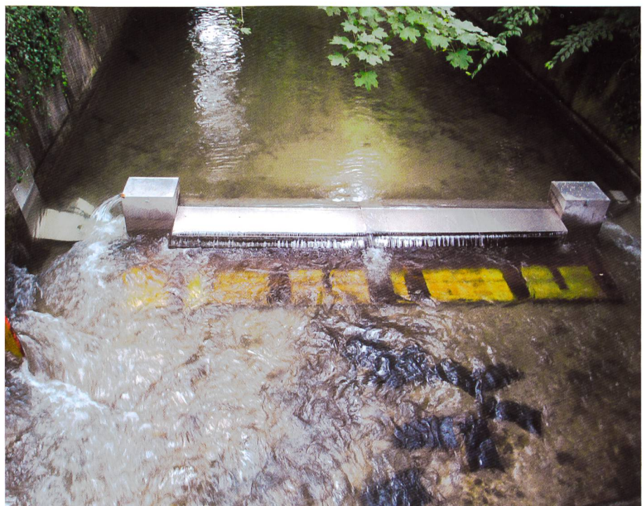
Bild 1. Fischpassierbare Krepssperre mit seitlichen Durchgängen für die Fische.

Im St.-Albenteich, einem Industriekanal in Münchenstein (BL), wurde 2013 ein erster Versuch mit einer Sperre gestartet, die das Aufsteigen der Flusskrebse verhindern sollte, aber für Fische seitlich passierbar wäre (Krieg et al., 2013) (Bild 1). Der Kanal hatte einen regulierbaren Wasserstand und besass auf beiden Seiten eine steile unüberwindbare Betonwand. Total wurden 300 Signalkrebse direkt unterhalb der Sperre ausgesetzt und mit ober- und unterhalb platzierten Reusen überprüft, ob diese die Sperre überwinden können oder flussabwärts wandern. Theoretisch war eine Überwindung nicht möglich. Aufgrund zeitweiser Absenkung des Wasserstandes wegen Bauarbeiten am Kanal sank die Strömungsgeschwindigkeit von den benötigten 0.65 m/s auf stellenweise unter 0.4 m/s. Zudem zeigte sich, dass die Konstruktion teilweise unterspült wurde. Ob dies der Grund war, wieso ein weiblicher Krebs die Sperre überwinden konnte, kann nicht bestätigt werden. Eine wichtige Erkenntnis war, dass sich mit den eingesetzten Reusen nur ein Bruchteil der Krebse, die sich im Gewässer befinden nachweisen lassen. Der Versuch markierte Krebse durch nächtliche Begehungen nachzuwei-