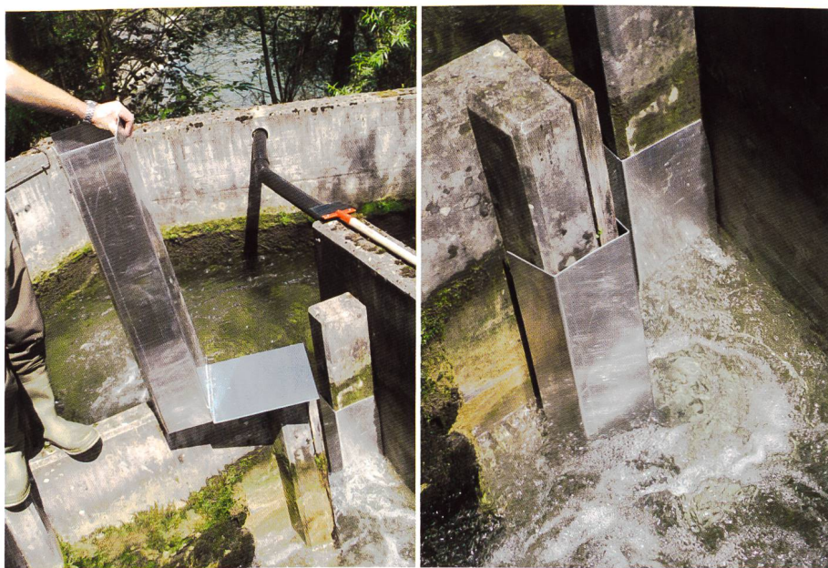
Bild 3. Mit Aluminiumblech ummantelter Beckenübergang in der Fischtreppe als Krebsperre. Links vor und rechts nach dem Einbau.