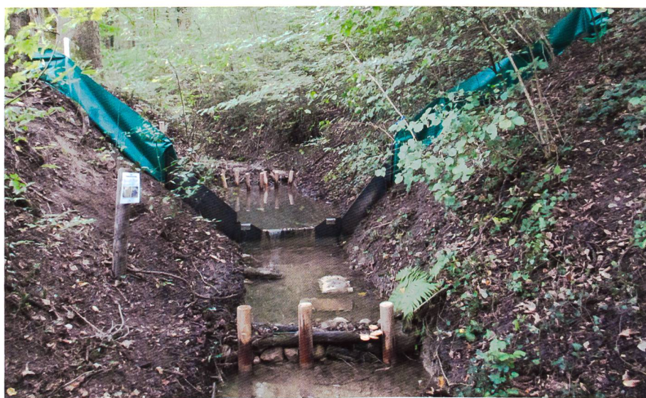
Bild 2. Krebsperre in Winterthur mit ausgebauter Landbarriere.