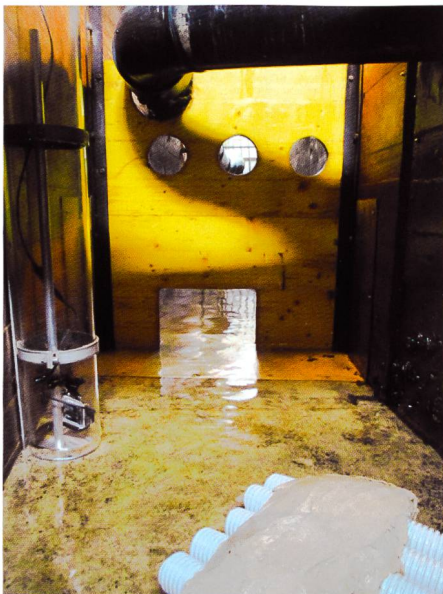
Bild 4. Aufbau des Fischtreppeversuchs von 2014: links die GoPro zur Überwachung des Durchganges. Im Vordergrund sind die künstlichen Verstecke zu sehen.

Beim zweiten Projekt 2014 im Beckenfischpass der SH-Power in Schaffhausen wurde das Aluminiumblech im oberen Ausgang der Fischtreppe eingebaut. Um im horizontalen Ausgangsbe-