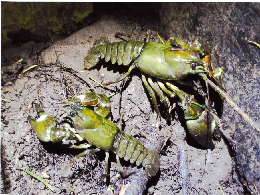
Bild 6. Zwei amerikanische Signalkrebse ( Pacifastacus leniusculus ) beim nächtlichen Landgang bei der Krepssperre in Winterthur.

die sich im Rhein ausbreiten (Dönni & Freyhof, 2002), könnte auch mit Krepssperren vonstattengehen. Hier braucht es weitere Kenntnisse über die Überwindbarkeit bei verschiedenen Strömungsgeschwindigkeiten durch Groppen und Grundeln.