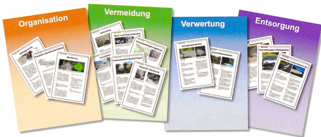
Bild 5. Übersicht der Massnahmenblätter zu den Kategorien «Vermeiden», «Verwerten», «Entsorgen» und «Organisation».

und Gemeinden auf der Ebene der strategischen Planung, aber auch bei der operativen Umsetzung von entsprechenden Massnahmen hilfreich sein.