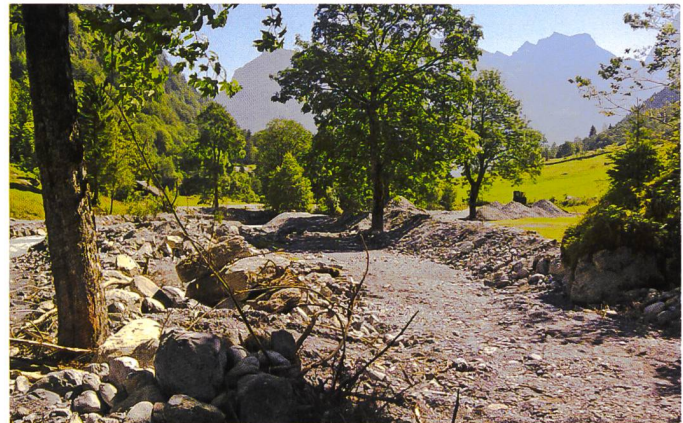
Bild 4. Geschiebeablagerungen durch den Alpbach im Gebiet Bodenberg nach dem Unwetter im Jahr 2010.

In Grindelwald ist davon auszugehen, dass sich die Gletscher im Einzugsgebiet der Schwarzen Lütschine stark zurückziehen und grosse Schuttdepots freigelegt werden. Die durch den Gletscherrückzug auftretenden Hangentlastungen sowie das Auftauen des Permafrostes können zu vermehrter Felssturzaktivität führen. Das Geschiebepotenzial wird also in Zukunft markant zunehmen und kann durch Hochwasserereignisse und insbesondere durch die weiterhin zu erwartenden Flutwellen ins Tal transpor-