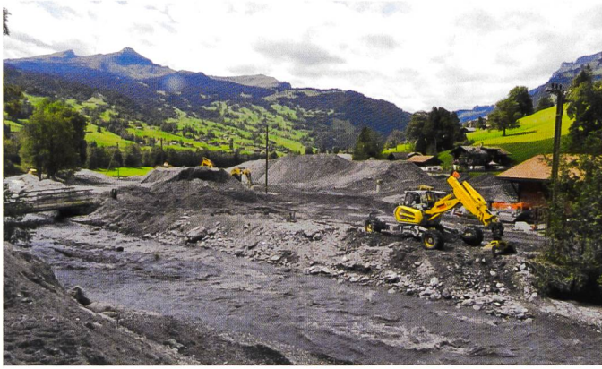
Bild 2. Geschiebeentnahmen an der Schwarzen Lütschine im Bereich Mättenbergbrücke in Grindelwald nach den Flutwellen im Jahr 2011.