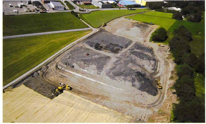
Bild 3. Deponie Plarenga bei Domat/Ems GR zur Entsorgung des Geschiebes aus der Val Parghera (Bild: Amt für Wald und Naturgefahren Graubünden).

(ausgelöst durch Niederschlag und/oder Schneeschmelze) zur Flutwellenaktivität durch Wasserausbrüche im Oberen Grindelwaldgletscher. Innerhalb eines Jahres wurden dadurch über 100 000 m 3 Geschiebe in den Talboden verfrachtet (siehe Bild 2), was rund der dreifachen Menge eines 300-jährlichen Hochwasserereignisses gemäss Gefahrenkarte entspricht.