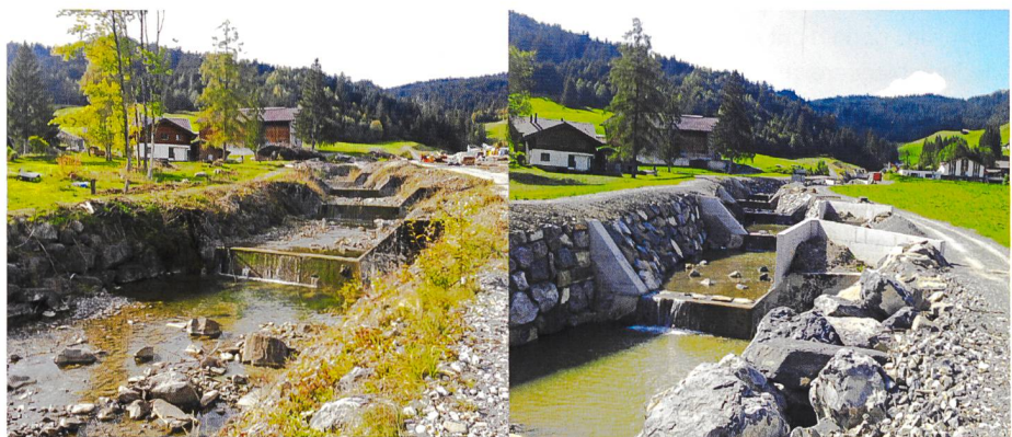
Bild 1. Ausleitstrecke mit klassischen Betonsperren vor dem Umbau (links) und nach der Fertigstellung mit erhöhten Flügeln, verengten Überfallsektionen und Ausleitspornen (rechts).

Die Zielgrössen des Modellversuches ergaben sich aus der gewünschten Ausleitcharakteristik. Die Ausleitung soll bei einem 100-jährlichen Abfluss von 60 \text{ m}^3/\text{s} anspringen. Für die Sicherheit des Dorfes muss ausserdem nachgewiesen werden, dass auch bei einem Zufluss eines EHQ von rund 100 \text{ m}^3/\text{s} an der Kantonstrassenbrücke mitten im Dorf keine unzulässigen Zustände entstehen.