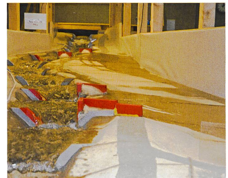
Bild 6. Beginn der Ausleitung bei den Sperren Nr. 22 und Nr. 23 (Vordergrund) sowie Nr. 27 und Nr. 28 (Hintergrund) im hydraulischen Modellversuch beim Dimensionierungsabfluss von 60 m 3 /s. Blick bachaufwärts.