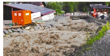
Bild 3. Abfluss bei der Kantonsstrassenbrücke am 24.6.16 (Video: Wuhrkorporation Nidlaubach).

Es lagerte sich eine erhebliche Menge Schwemmholz im Holzrechen ab. Der Rechen funktionierte sehr gut. Es wurde kein Holz ausgetragen, und das Holz wurde wie angestrebt vom Geschiebe separiert. Die