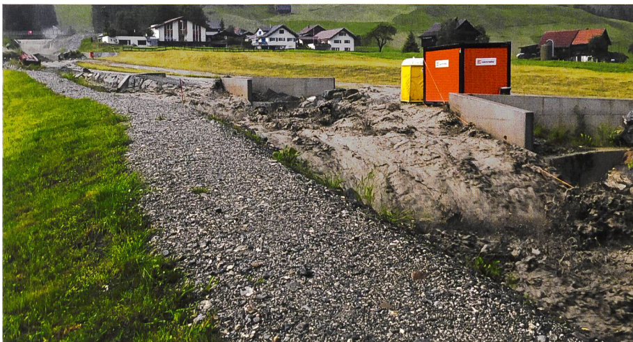
Bild 5. Ausleitung im Höchststand bei den Sperren Nr. 22 und Nr. 23. Blick vom rechten Ufer bachaufwärts.