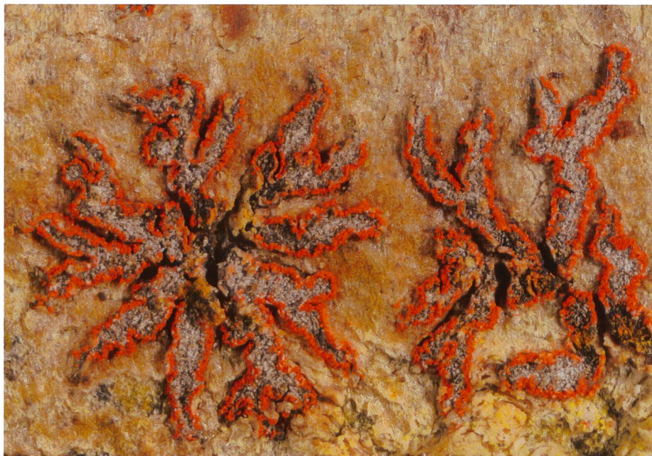
Bild 6. Die Zinnoberrote Fleckflechte ( Arthonia cinnabarina ) ist auf junge Eschen in Hartholzauenwäldern angewiesen.

abnimmt. Populationsgenetische Daten können so auch zur Beschreibung der Habitatvernetzung eingesetzt werden.