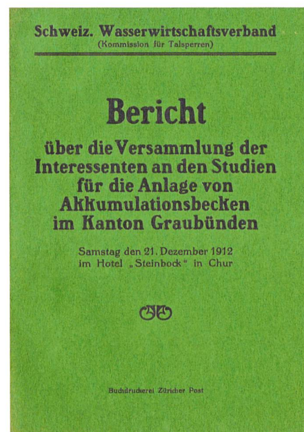
Bild 1. Bericht zur Versammlung am 21. Dezember 1912 als eigentlichem Startschuss zur Gründung.

Als erster Verbandspräsident wurde der Bündner Nationalrat Josef Dedual gewählt, der anschliessend während 22 Jahren die Geschicke des Verbandes leitete. Auch die weiteren an der Versammlung gewählten Vorstandsmitglieder waren durchwegs