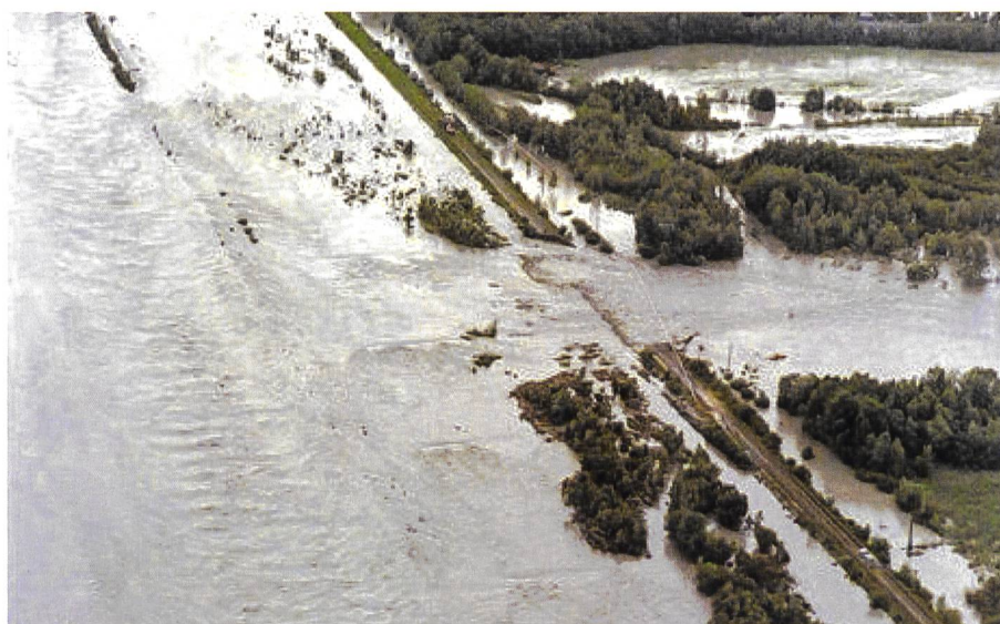
Bild 3. Dammbreach am unteren Alpenrhein bei Fussach während des Hochwasserereignisses 1987 (Quelle: Archivbild St. Galler Tagblatt).

Mit dem zweiten Hauptanliegen, den Wildbachverbauungen und Geschiebesammlern in den Erosionsgebieten, zielte man auf die Verminderung des Geschiebeaufkommens und der Aufschotterung des Rheins, welche im Rheintal immer wieder zu verheerenden Hochwasserereignissen beigetragen hatte, so unter anderem 1910 und 1927 sowie in neuerer Zeit auch 1954, 1987, 1999 und 2005 (Bild 3).