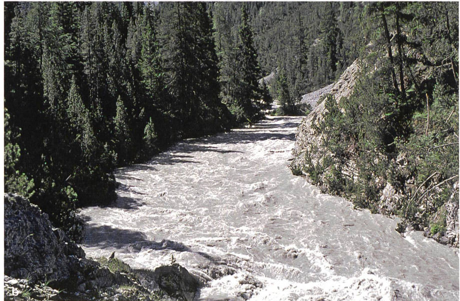
Bild 7. Der Spöl bei Restwasser- (a, Abfluss ca. 1.5 m 3 /s) und bei Hochwasserabfluss (b, Abfluss 43 m 3 /s).