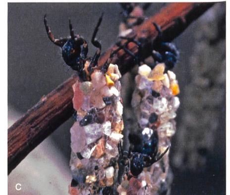
Bild 2. Lebewesen beeinflussen die Geschiebedynamik. a) Wasserpflanzen halten Feinsedimente zurück. b) Biberdämme führen zur Ablagerung von Feinsedimenten. c) Larven der Köcherfliegenart bauen ihre Köcher aus Sedimentpartikeln.

nisse des Forschungsprojekts sind in der hier vorgestellten Merkblattsammlung (BAFU 2017) zusammengefasst. Sie ist die Fortsetzung der Merkblattsammlung «Wasserbau und Ökologie», die im Jahr 2012 erschienen ist (BAFU 2012). Wie bei der ersten Ausgabe wurden die Themen und Inhalte in engem Austausch mit Praktikerinnen und Praktikern verschiedener Fachbereiche aus Verwaltung und Interessensverbänden erarbeitet. Die Merkblätter informieren die Leserinnen und Leser