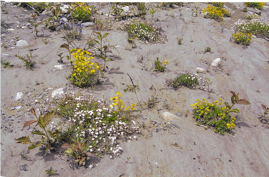
Bild 4. Ablagerungen von Feinsedimenten in der Kander (BE) bieten Pionierpflanzen der Schwemmufervegetation alpiner Wildbäche einen Lebensraum.

Faktoren (z. B. Totholz, Uferbewuchs). Die Fließgewässerbewohner haben vielfältige Anpassungen entwickelt, um mit der Sedimentdynamik umzugehen (Bild 2). Algen bilden abriebresistente Formen, z. B. durch Verdickung ihrer Zellwände. Bei Flussfischen wurden innerartliche Unterschiede in der Körperform dokumentiert, je nachdem, ob sie vorwiegend Kolke mit feinem Sediment und geringen Fließgeschwindigkeiten (Pools) bewohnten oder Schnellen mit gröberer Sohle und höherer