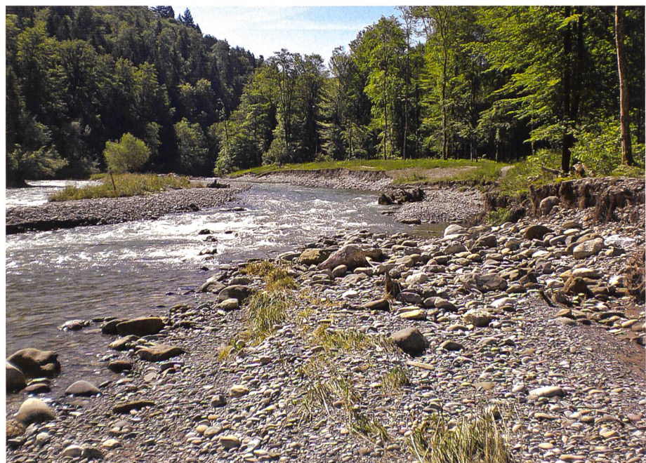
Bild 8. Durch künstliche Insel induzierte Ufererosion an der Töss (ZH) im Jahr 2013.

Eine kontrollierte und ökologisch optimierte Abgabe von Wasser und Sediment beim Betrieb von Sedimentumleitstollen und das Auslösen eines künstlichen Hochwassers können die Sedimentverhältnisse im Unterlauf verbessern. Die optimierte Abgabe trägt zur Umlagerung von Sediment und organischem Material bei und fördert die Entstehung neuer Habitats. Die hydrologischen Charakteristika der beiden Ansätze sollen sich hinsichtlich Zeitpunkt (Saisonalität), Spitze, Dauer, Häufigkeit etc. an den ursprünglichen Verhältnissen des Abflussregimes orientieren (Bild 7). Jede Situation erfordert ein individuelles Bewirtschaftungskonzept. Dieses sollte durch ein Monitoring begleitet werden, um verschiedene Flüsse zu vergleichen und einen Lernprozess zu ermöglichen. Es ist relativ neu, dass das Sedimentregime beim ökologischen Unterhalt von Flüssen berücksichtigt wird. Die Verant-