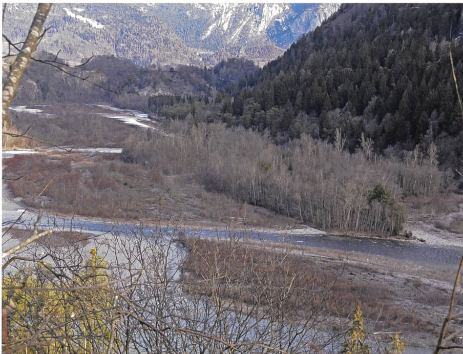
Bild 6. Aue bei Rhäzüns (GR) im Februar 2015. Offene Kiesflächen und Kiesbänke mit Pioniervegetation sowie Weichholzaunen bilden gemeinsam mit Flussstellen mit variierender Fließgeschwindigkeit und Abflusstiefe einen dynamischen Lebensraumverbund.

Lebewesen sowie die Ufervegetation. Durch die reduzierte Fließgeschwindigkeit sinkt jedoch auch die Schleppkraft der Strömung, und Sedimente setzen sich ab. Insbesondere in Gewässern, die von Schwall und Sunk betroffen sind, stellt sich die Frage, wie der Ablagerungsprozess von Feinsedimenten in Uferbuchten verläuft. Werden die Ablagerungen bei Hochwasser- oder Schwallabfluss wieder ausgewaschen oder verlanden die Uferbuchten? Um diese Fragen zu beantwor-