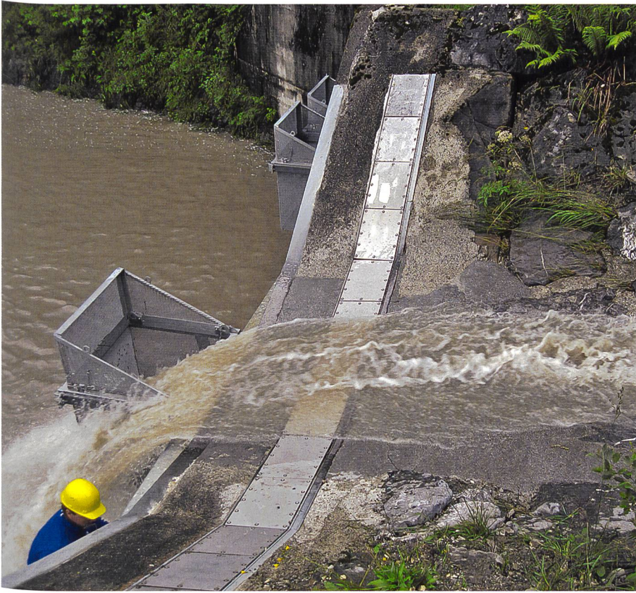
Bild 3. Geophon zur direkten Messung des Geschiebevolumens im Erlenbach.