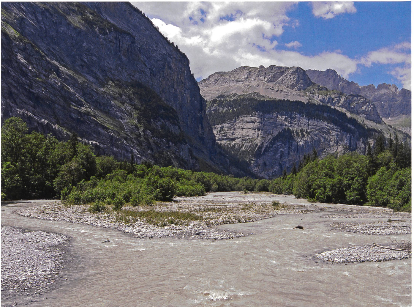
Bild 1. Die Kander im Gasterntal (BE) wird von einer naturnahen Sediment- und Abflussdynamik geprägt.