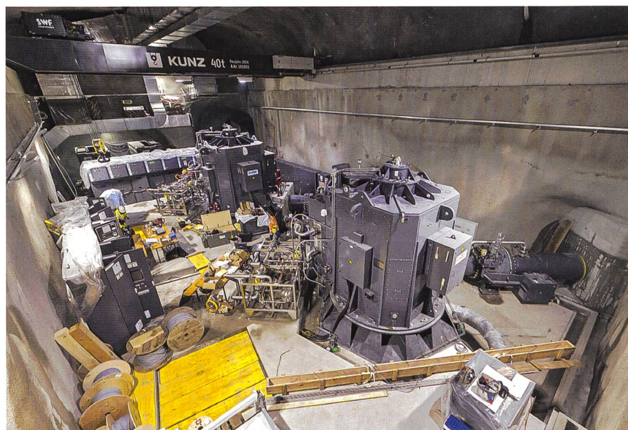
Bild 6. Montage der Maschinengruppen.