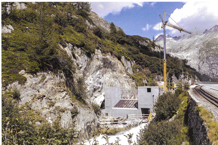
Bild 4. Bau des Tirolerwehrs.

Das Fassungsbauwerk (Tirolerwehr) sowie der Innenausbau der Entsanderkaverne in Gletsch wurden während der Sommermonate (2015–2017) realisiert. Während der Erstellung dieser Bauwerke sorgte eine permanente Hochwasserüberwachung