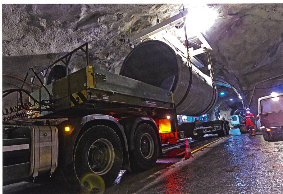
Bild 5. Montage der GFK-Rohre.