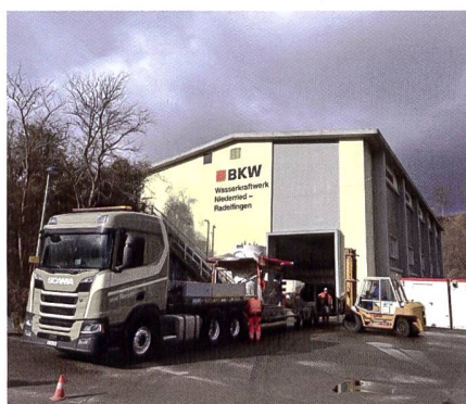
Kraftwerk Niederried-Radelfingen.

Das Wasserkraftwerk Niederried-Radelfingen wurde in den Jahren 1959 bis 1963 neben dem bereits bestehenden Stauwehr des Kraftwerks Kallnach erbaut. Die letzte Generalrevision der Maschine fand 1990/