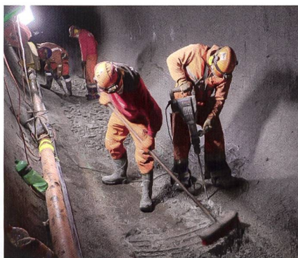
Stollensanierung im Kraftwerk Göschenen.

Nebst der Stollensanierung ersetzt das KWG in einem Mehrjahresprogramm die Mehrheit der Maschinenkomponenten. Dazu gehören Turbinenräder, Generatoren,