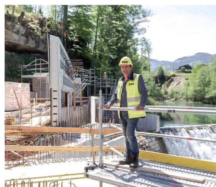
Pilotanlage zu Fischleitrechen beim Kraftwerk Herrentöbeli.

Weitere Infos dazu auf unserer Website: www.swv.ch/news .