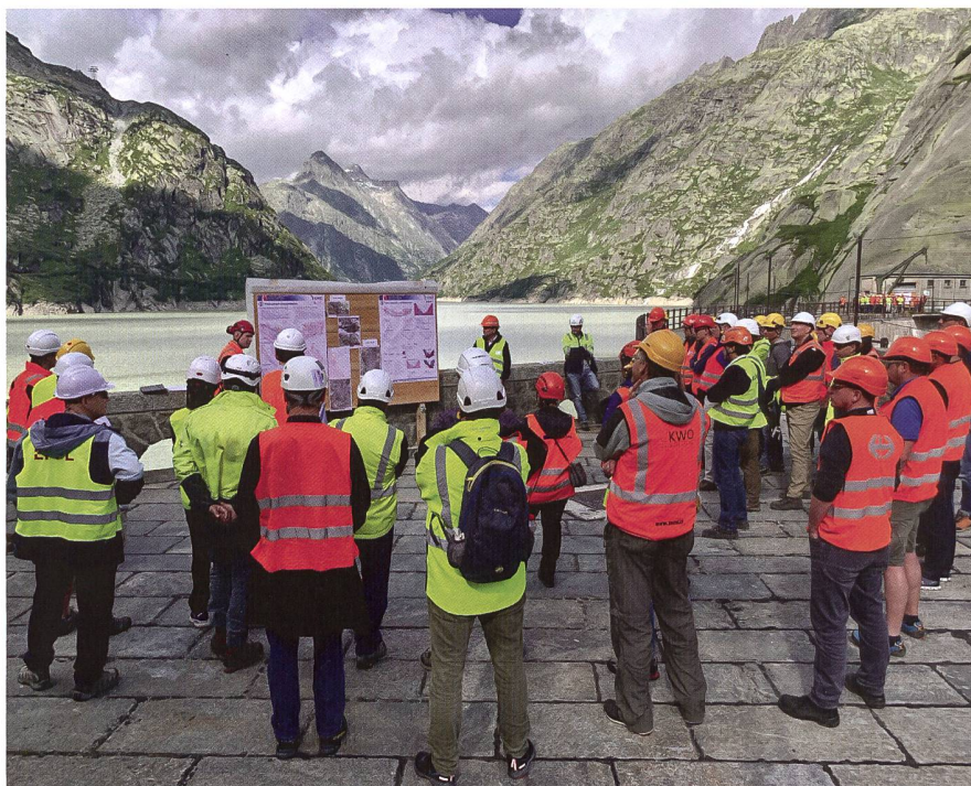
Bild 3: Experten informierten die Teilnehmer an vier interessanten Posten über verschiedene Aspekte.

Nach dem feinen Nachessen kehrten die Teilnehmerinnen und Teilnehmer in ihre Unterkünfte zurück, einige in Meiringen selbst, während die Abenteuerlustigen mit einer Extra-Bergfahrt der Seilbahn auf den Hasliberg fuhren.