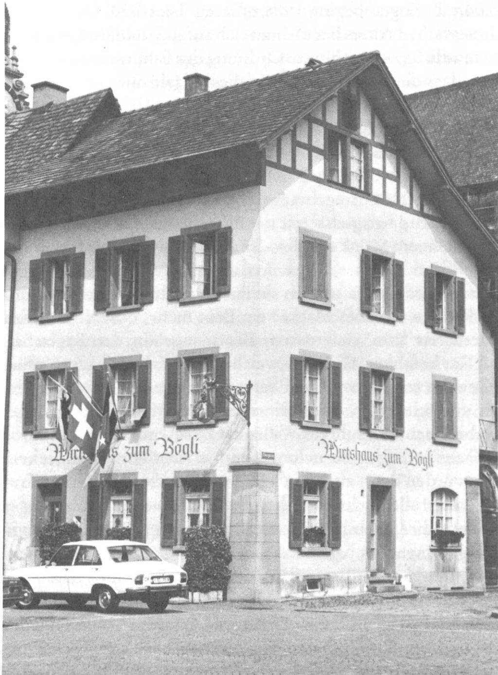
Das Haus der Schützenzunft