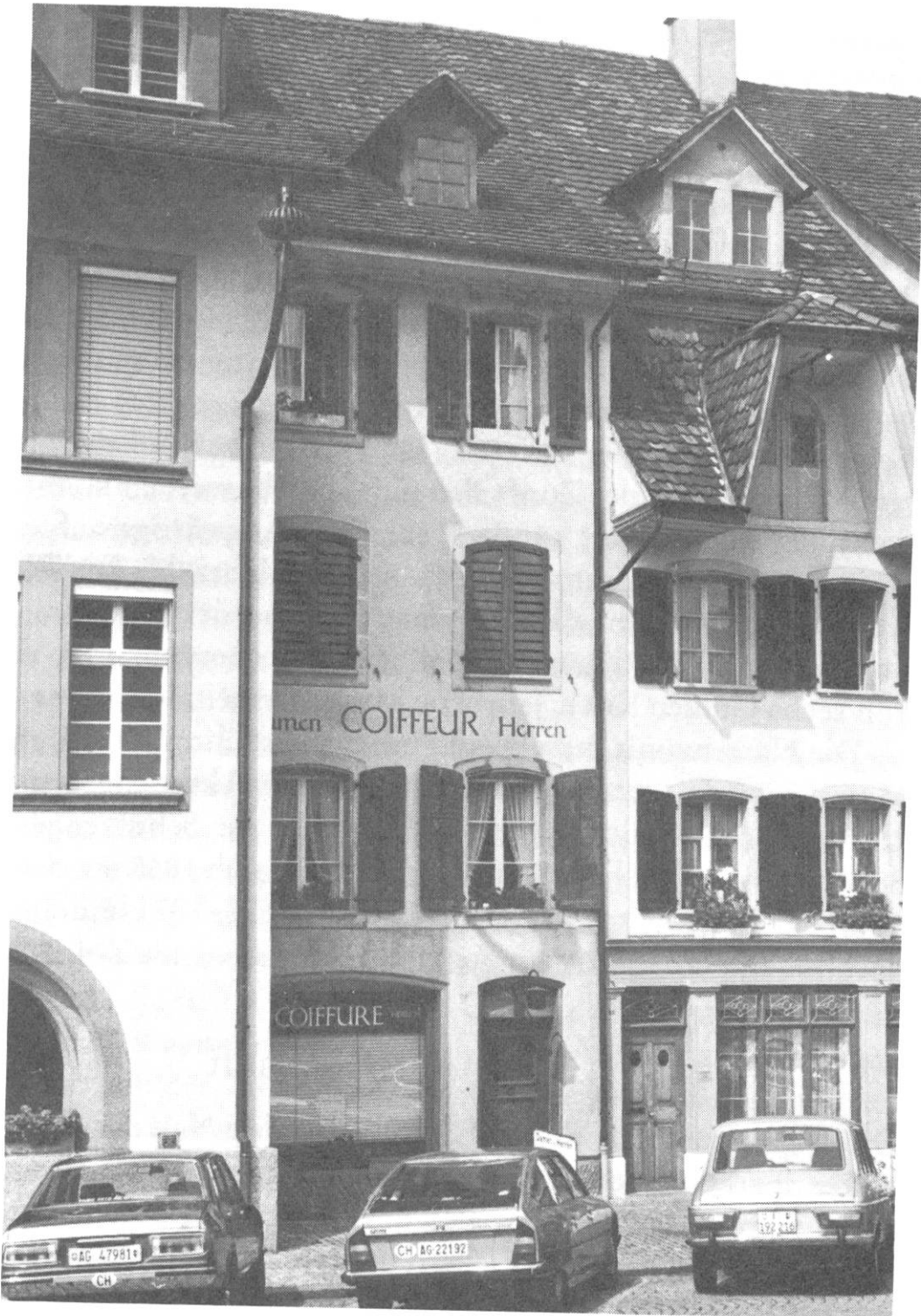
Das Haus der Narrenzunft