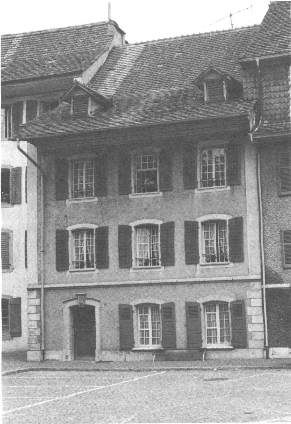
Die Liegenschaft der Schneidernzunft