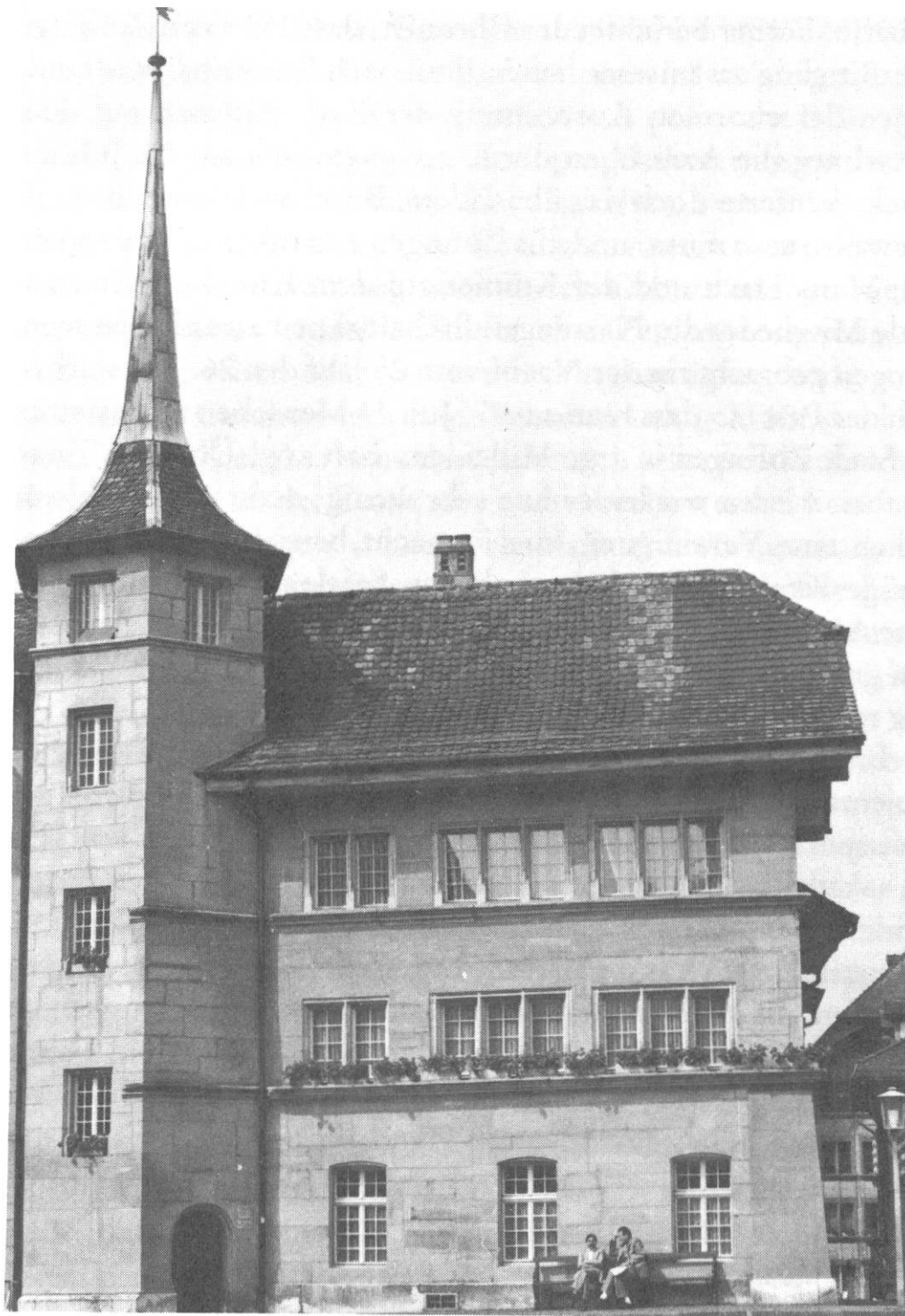
Das Gebäude der Metzgerzunft