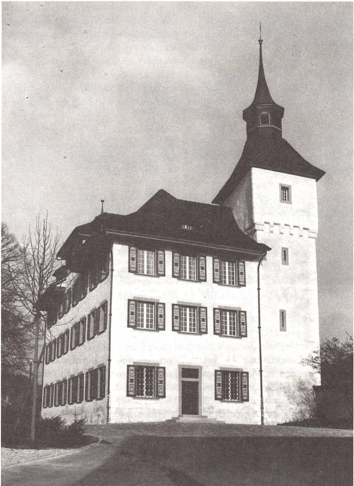
Das restaurierte Landvogteischloss Willisau. Erbaut 1690–1695 samt Befestigungsturm Ende 15./anfangs 16. Jahrhundert. Hauptzugang mit Vorplatz. Westfront.