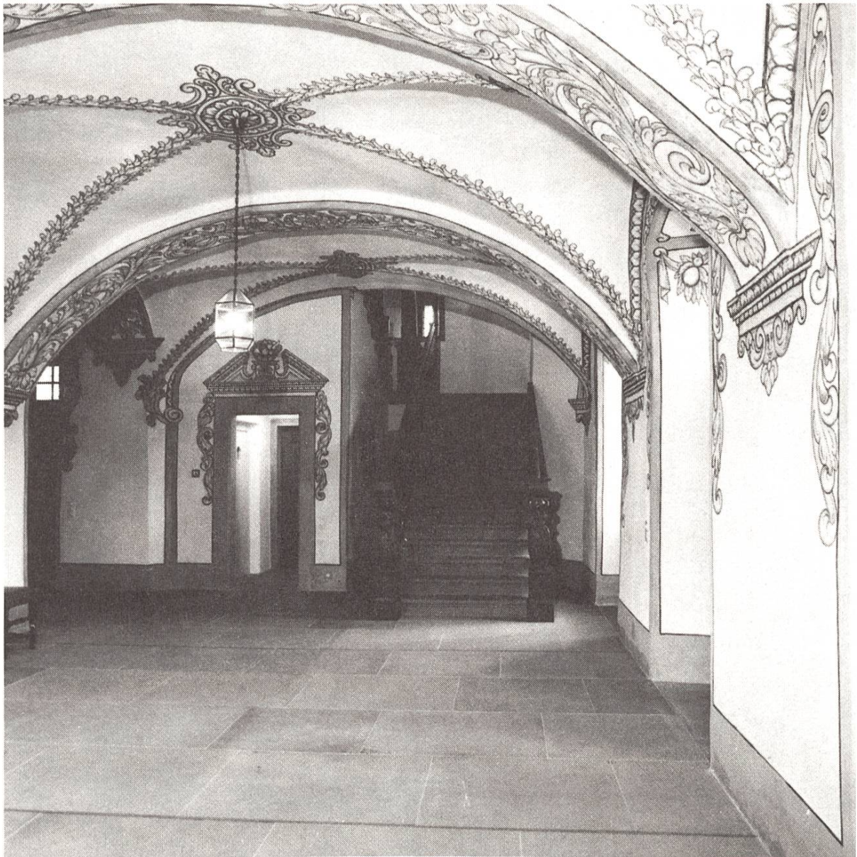
Entrée mit Grisaillemalereien. Treppenaufgang.