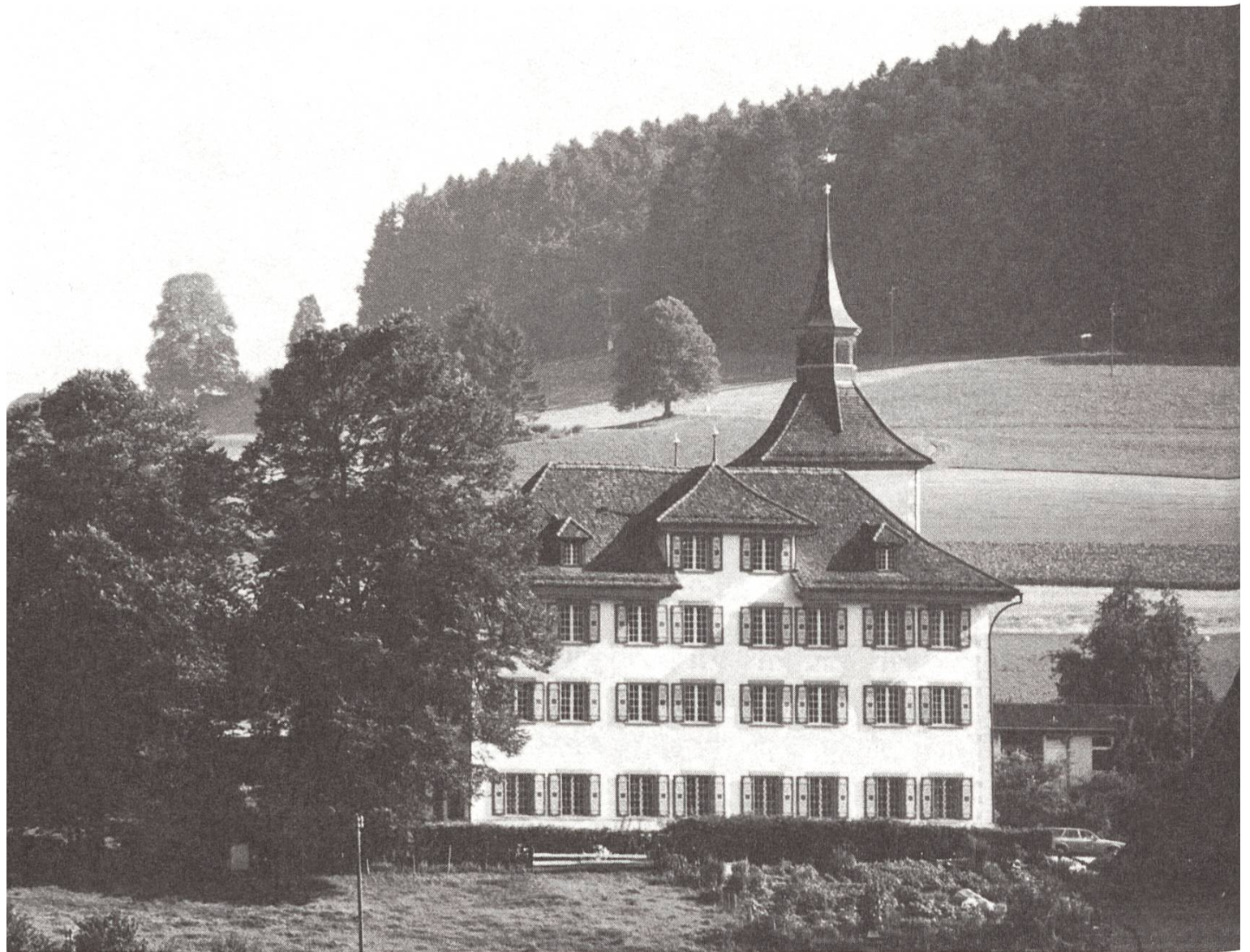
Der behäbige Baukörper mit seiner einfachen, harmonischen Architektur. Nordseite.