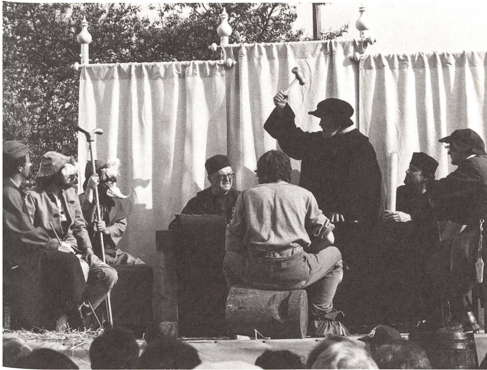
Szene aus dem spätmittelalterlichen Spiel vom klugen Knecht.