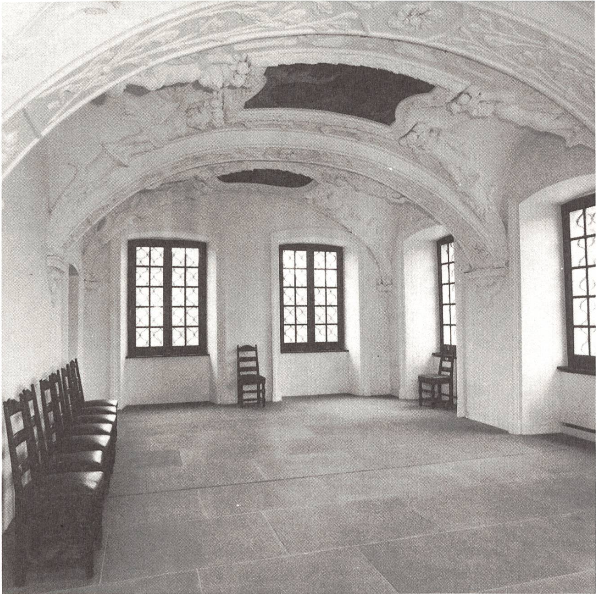
Gerichtssaal im Erdgeschoss mit Stukkaturen und Fresken.