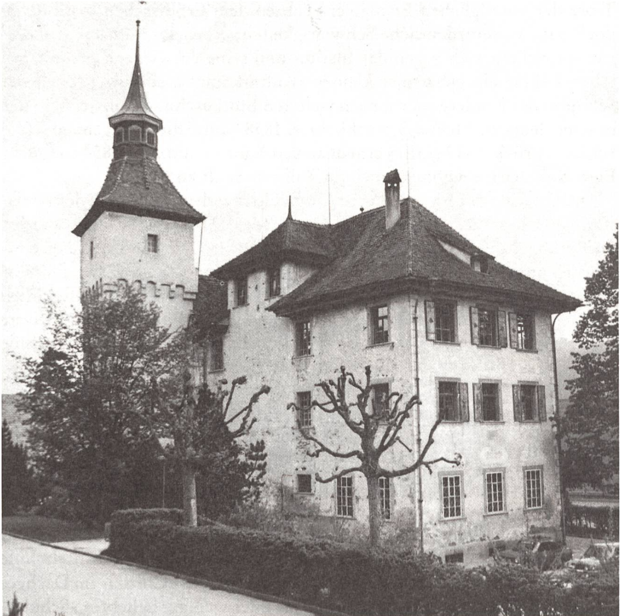
Das Land- oder Amtsvogteischloss vor der Restauration. Blick von Südosten.