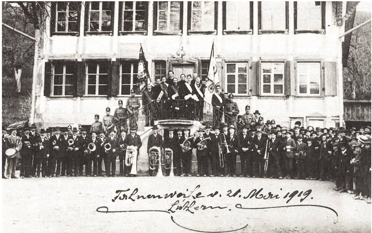
3 Gemeindehaus zur «Wölfen» 1919.