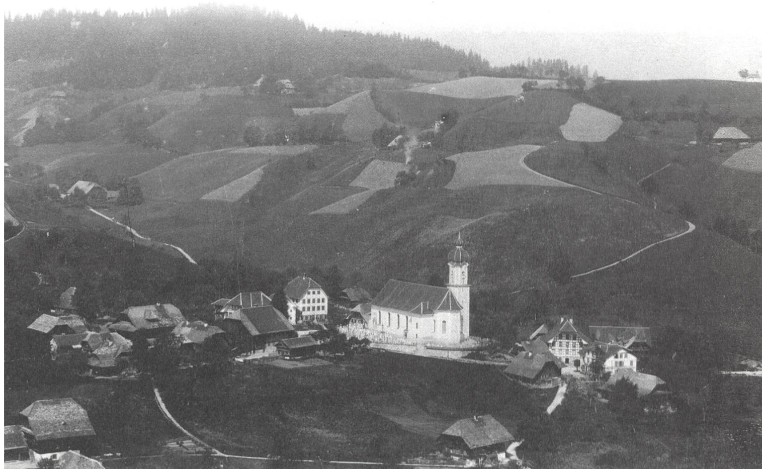
7 Blick auf Alt-Luthern um 1858.

Die Verteilung der Liebesgaben blieb nicht immer auf die in der Gemeinde wohnenden Armen beschränkt. Das Wort «Bürgerrecht» wurde damals noch ernster genommen. Laut Protokoll von 1891 wurden auch auswärts wohnende Gemeindebürger gelegentlich unterstützt. Das Wohnortsprinzip in Sachen Unterstützung ist im Kanton Luzern erst ab geltendem Armengesetz von 1935 konsequent durchgeführt worden.