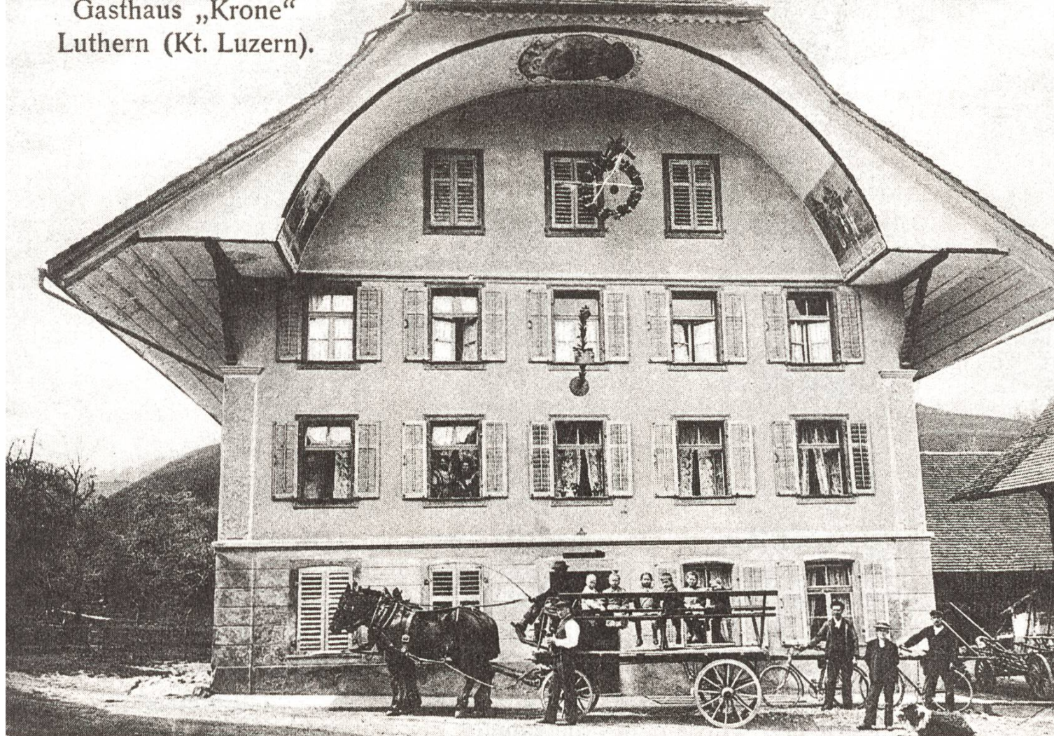
2 Gasthaus Krone um 1912.

Der Antrag drang durch und die, verglichen mit heutigen Anlässen, sicher bescheidene Lustbarkeit ging unter. Der Verein setzte sich aber auch für Arbeitsbeschaffung ein. Zum Beispiel mittels Seidenspinnen, Anpflanzungen und Gemeindewerke. Das Ergebnis war zweifellos mager. Am 29. September 1855 war angeblich fast die ganze Gemeinde im Verein. Ihre Beitrittsverweigerung begründeten die wenigen Opponenten damit, dass man nicht wünsche, dass daraus eine neue Pflicht erwachse (zusätzliche Steuer), dass man selbst arm sei und auch aus Protest, dass die Sennenkilbi abgeschafft worden sei.