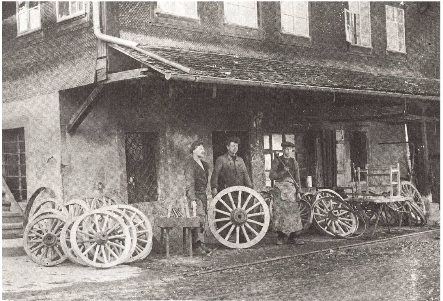
4 Dorfschmiede Luthern in den zwanziger Jahren.

dringen ein christliches Leben zu führen. Finden sie, dass verdungene Kinder weder gehörig gepflegt, noch christlich erzogen werden, so haben sie dieses unverweilt dem Vorstande anzuzeigen.»