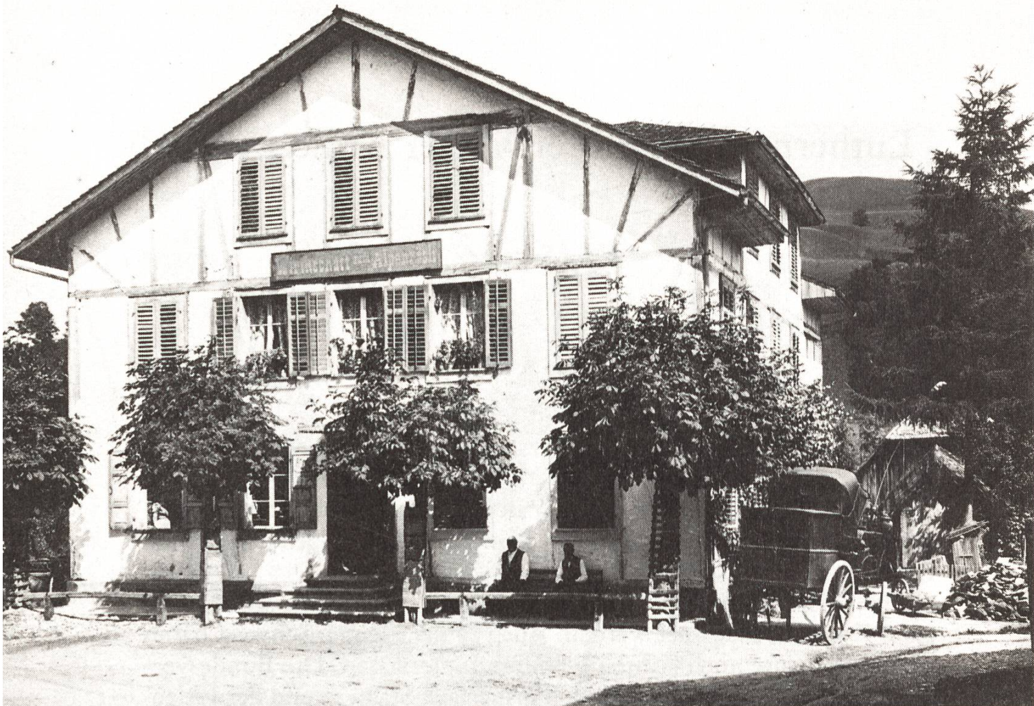
1 Restaurant Alpenrösli im Unterdorf (heute Haus «Fischer») um 1900.