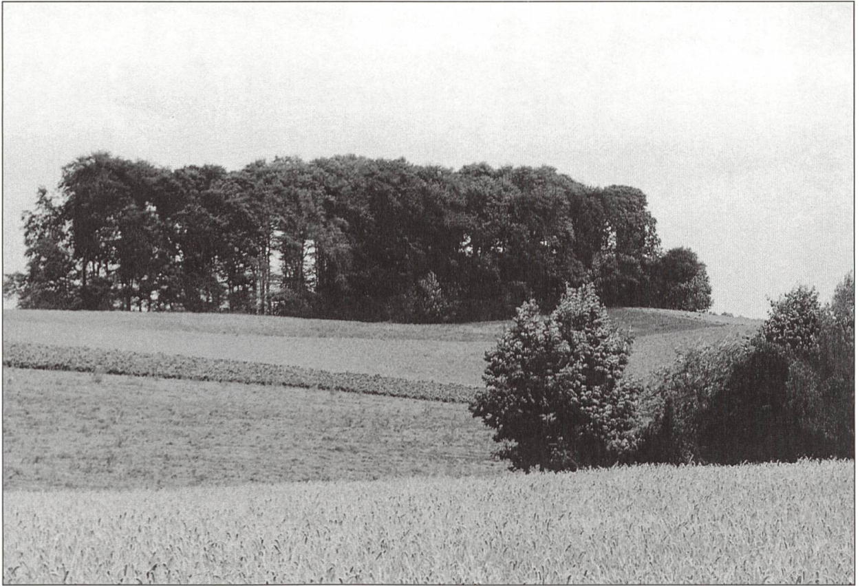
Buchen-Hallenwald vor 30 Jahren.