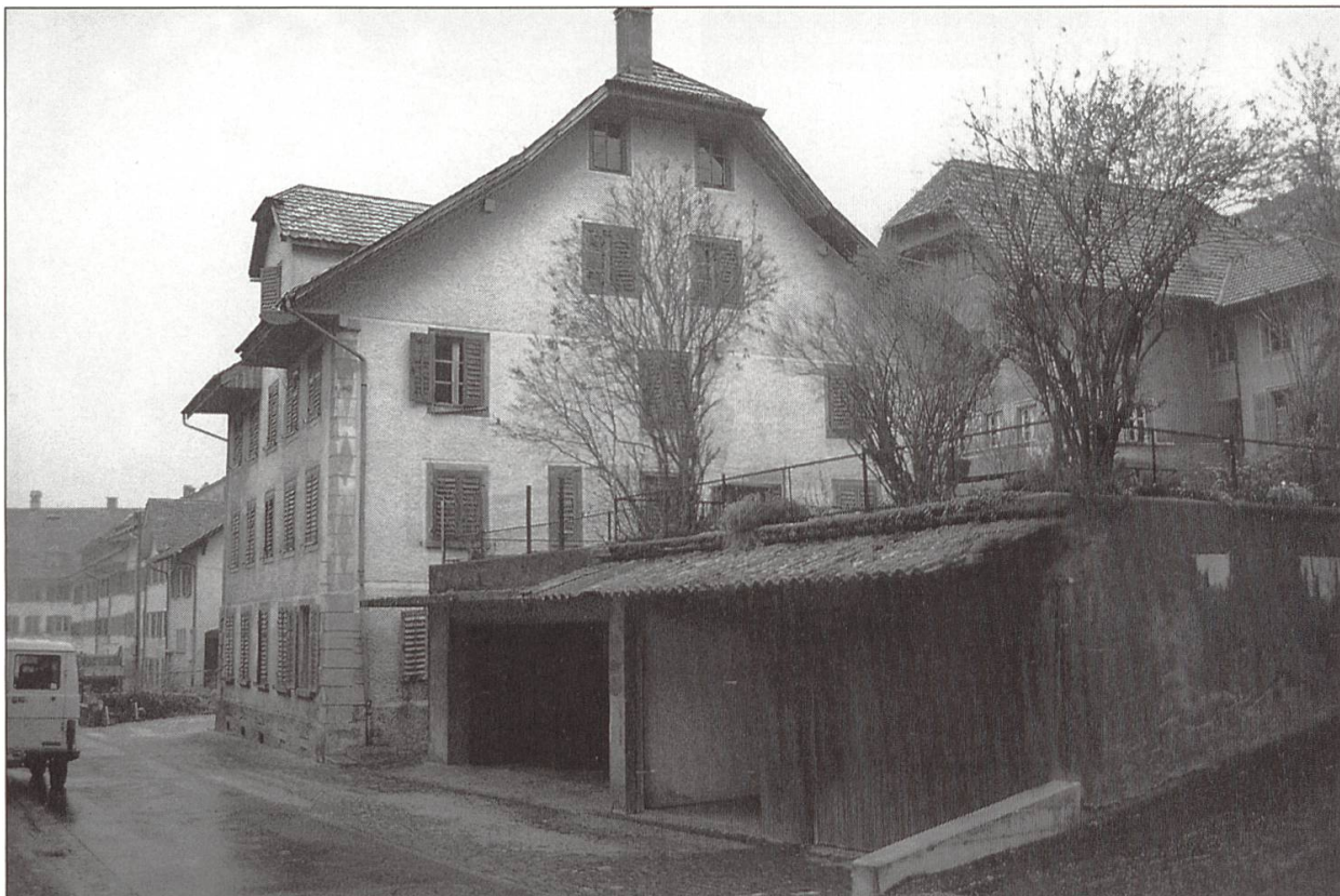
Das Haus an der Chilegass 15 bevor es 1997 abgerissen wurde.

Grund dafür sind zum einen die Fugen dazwischen: Sie bilden optisch das Gerüst der Fassade und sind doch Leerräume. Die Platten hängen dadurch in der Luft, die Fassade scheint nicht fix und starr, sondern leicht und beweglich. Zum andern sind die Sperrholzplatten selbst mit Klarlack beschichtet, der dem Holz einen leichten Glanz verleiht. Holz, ein an sich einfaches, armes Material, erhält durch diese Oberflächenbehandlung den irritierenden Anschein von etwas Wertvollem.