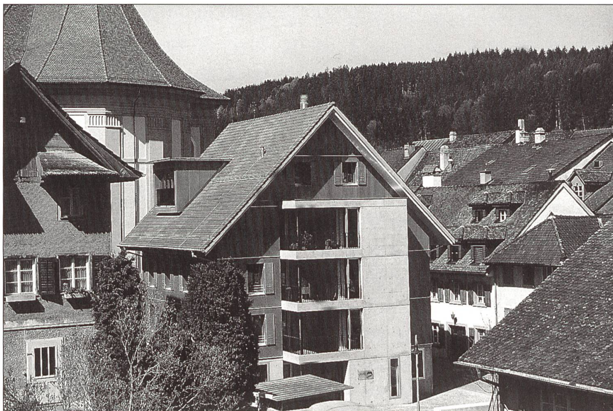
Chilegass 15 im historischen Stadtbild.

ihr, das heisst, sie schliessen die Sperrholzhaut beinahe nahtlos zu, wie Schubladen oder genau eingepasste Fächer bei Möbelstücken. Die Fassade mit geöffneten Läden hat dadurch einen grundsätzlich anderen Charakter als mit geschlossenen.