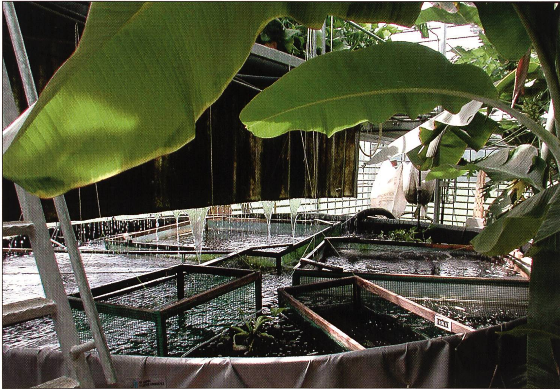
Aquakultur im «Tropéhuus Ruswil», Sommer 2001.

den lokal produzierten Frischprodukten verarbeitete Produkte aus Entwicklungsländern, z.B. Trockenfrüchte, Chutneys usw., zu verkaufen. Mit diesem Projekt wird eine neue Form der Zusammenarbeit zwischen Bauern in Luzern und Bauern in Entwicklungsländern möglich.