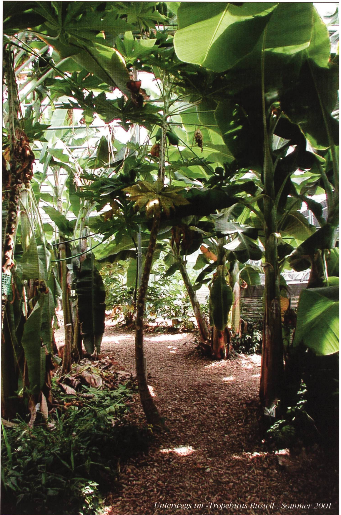
Unterwegs im 'Tropenhaus Ruswil', Sommer 2001.