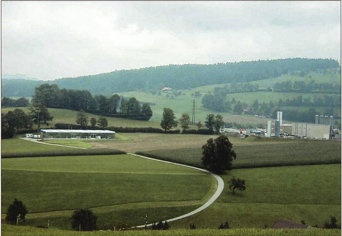
«Tropheuus Ruswil» (links) mit Transitgas-Verdichtungsstation (rechts), Sommer 2000.

Wegen marktstrategischen Überlegungen (Produktion von subtropischen bis tropischen Früchten als Nischenprodukte) und aus Gründen des Landschaftsschutzes (Minimierung der Gewächshausflächen) wurde das Versuchsgewächshaus als tropisches bis subtropisches Polykultursystem geplant: Mit den hier realisierten Gewächshäusern soll die Produktion wirtschaftlich interessanter Nischenprodukte gefördert werden.