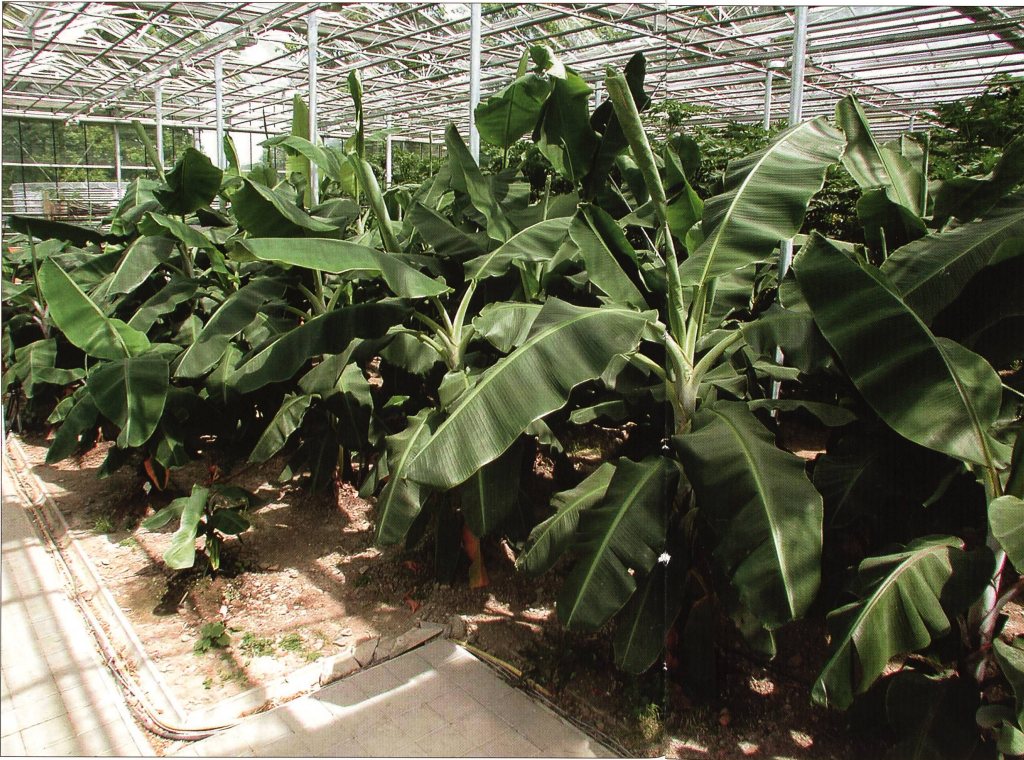
Bananenplantage im "Tropenhaus Ruswil", Frühjahr 2001.