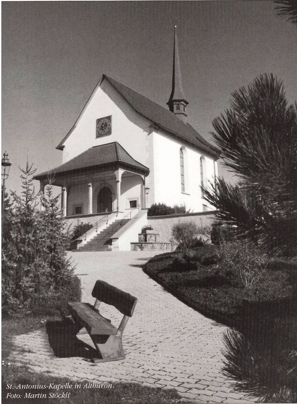
St.-Antonius-Kapelle in Altbüren.