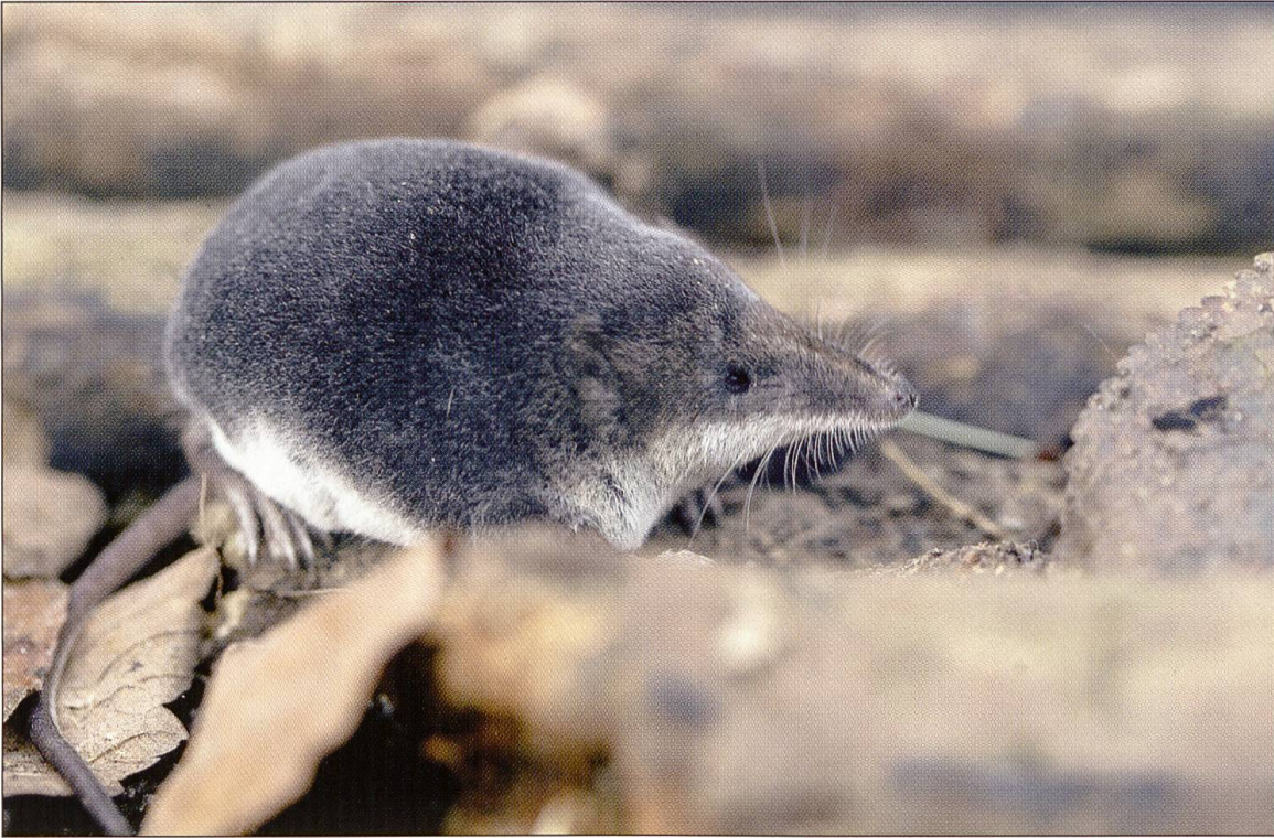
Abbildung 6: Die Wasserspitzmaus ( Neomys fodiens ) besitzt, um besser tauchen zu können, sowohl an den Füßen als auch am Schwanz lange Borsten. Sie kann mit ihrem Biss die Beute lähmen, die sie dann an Land zieht und dort frisst.

wir im August 2001 ein Tier, das sich 150 m vom nächsten Wohnhaus entfernt befand (Holzgang & Pfunder 2002). Am zweiten Fotofallen-Standort wollten sich leider keine Tiere blitzen lassen.