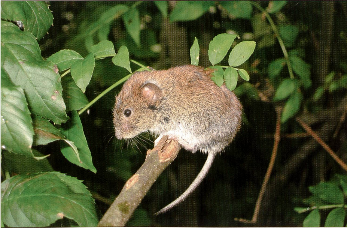
Abbildung 3: Rötelmäuse ( Clethrionomys glareolus ) sind gute Kletterer, obwohl sie zu den Wühlmäusen gehören. Sie halten sich bevorzugt an feuchten Standorten mit dichtem Unterholz auf.