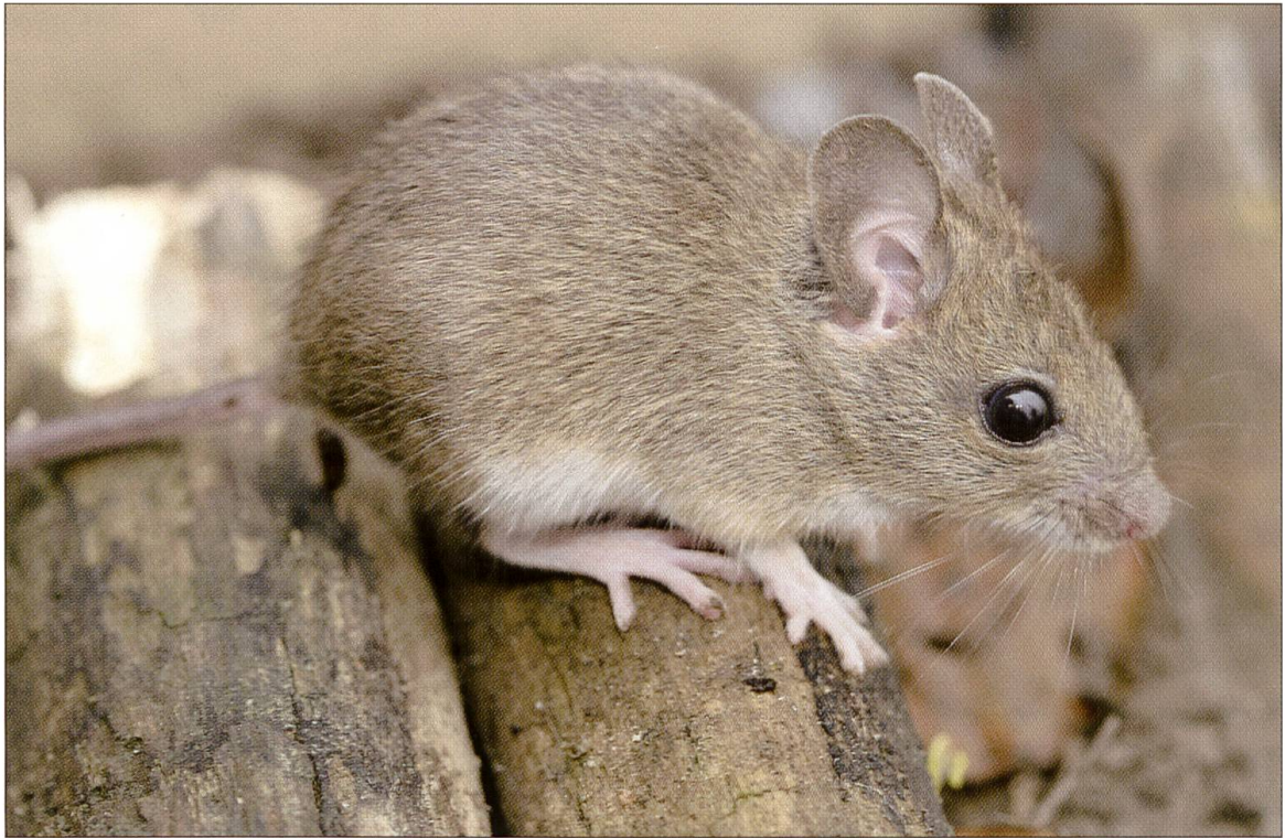
Abbildung 2: Die kletter- und sprungfreudige Waldmaus ( Apodemus sylvaticus ) kommt bevorzugt bei Gebüsch und Hecken vor.