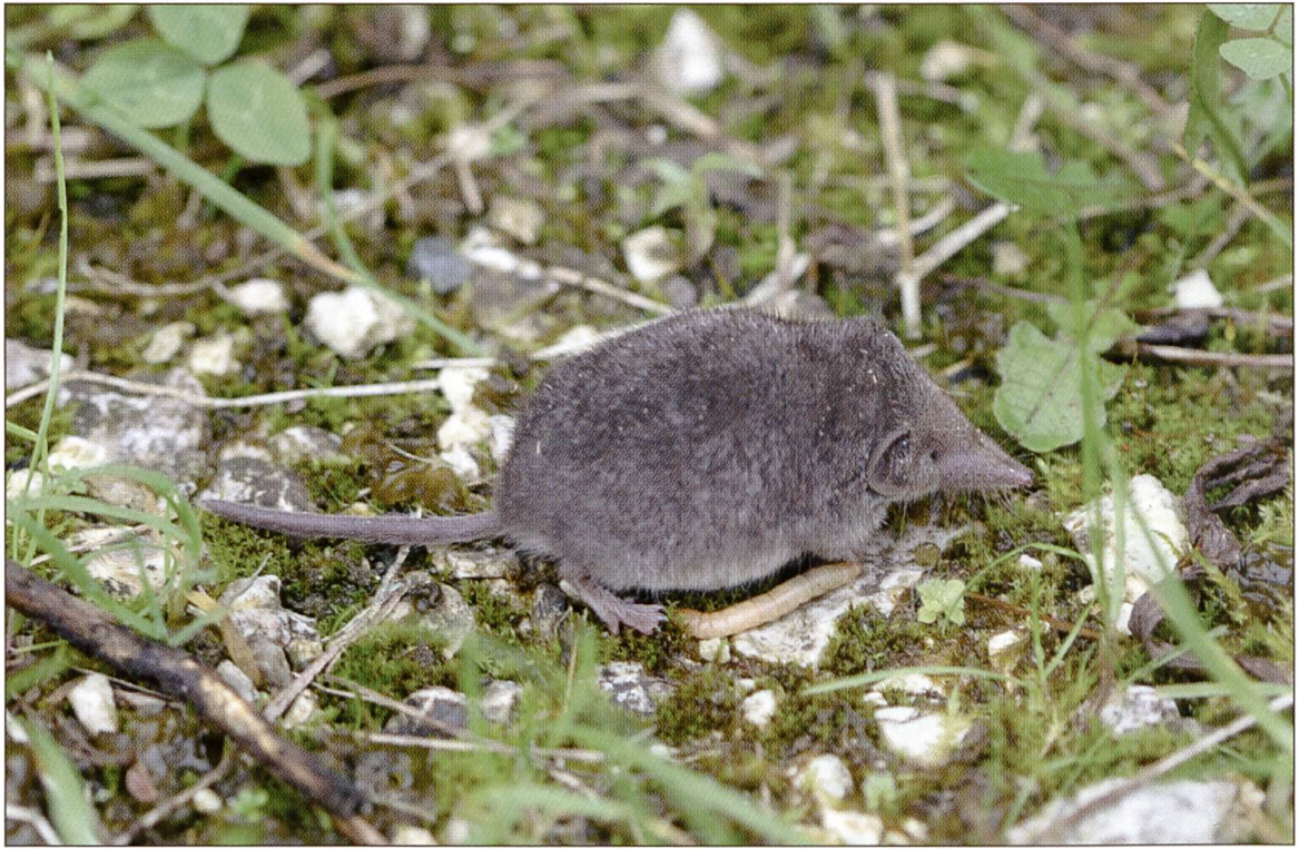
Abbildung 7: Der Schwanz der Hausspitzmaus ( Crocidura russula ) besitzt abstehende Wimpernhaare. Katzen bringen oft Hausspitzmäuse nach Hause.

zurückgegangen. Ihr heutiges Vorkommen im Gebiet ist unserer Meinung nach sehr unsicher.