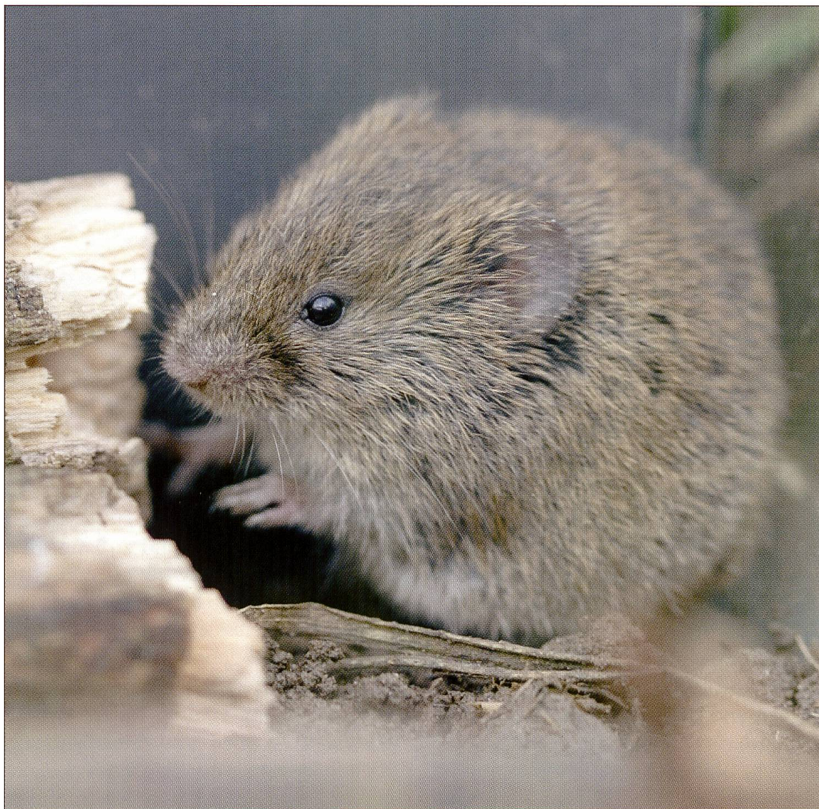
Abbildung 5: Die Feldmaus ( Microtus arvalis ) ist sehr anpassungsfähig und kann mit Ausnahme des geschlossenen Waldes fast überall angetroffen werden.

von der Schnauzenspitze bis zum Schwanzende – eine grosse Spitzmaus. Sie ist stark an das Wasser angepasst. Hier jagt sie in erster Linie wirbellose Wassertiere, indem sie bis zu 50 cm tief taucht. Die Tauchphase kann 5 bis 20 Sekunden dauern und sich mehrfach wiederholen, bis das Tier gesättigt ist. Bereits zwei bis drei Stunden später geht sie wieder auf die Jagd, um ihren hohen Energiebedarf zu decken. Die