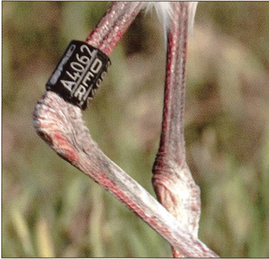
A 4062 wurde am 17. Juni 2004 in Südbaden (D) beringt und hielt sich mindestens vom 15. bis 18. August 2004 im Wauwilermoos auf und übernachtete auf der Kirche Schötz.