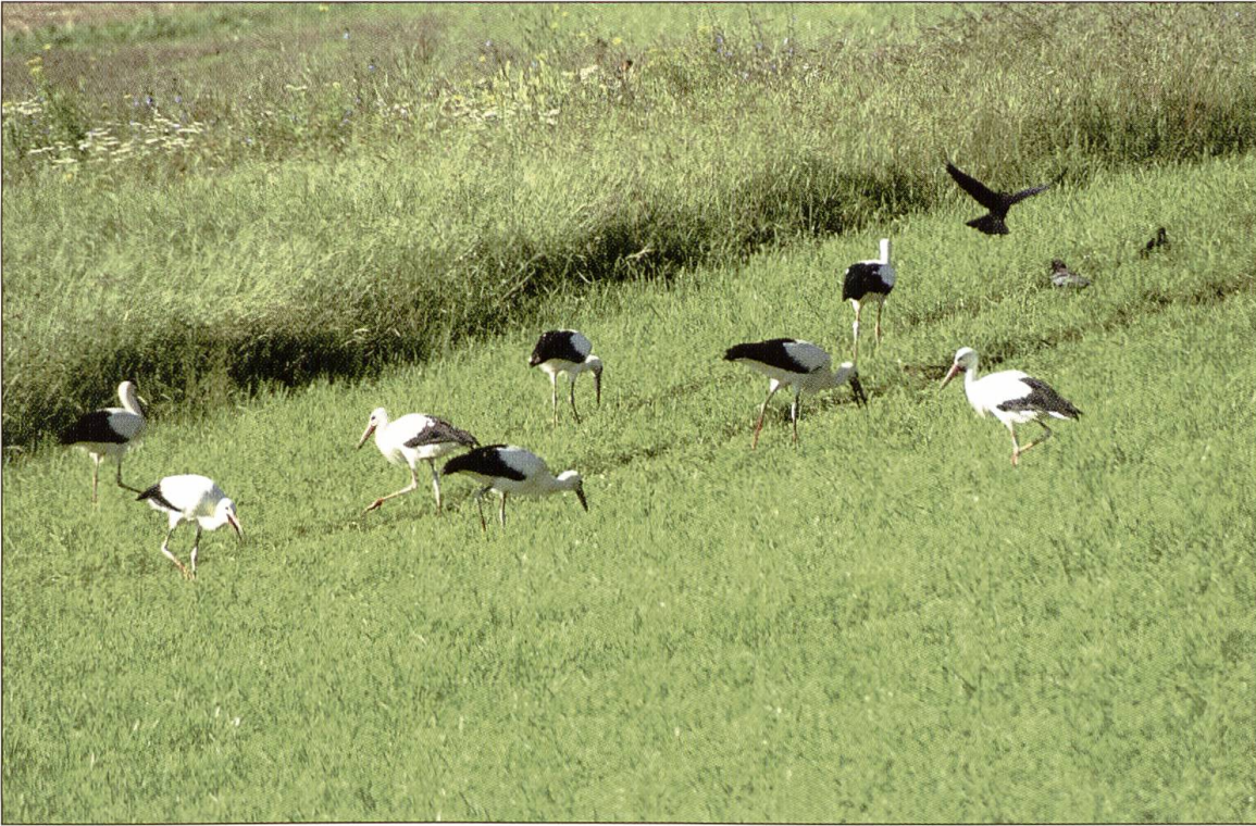
Die extensivierten Wiesen im Wauwilermoos bieten Futter für die grosse Gruppe während mehrerer Tage.

zeit wieder vermehrt durchziehende und rastende Störche im Wauwilermoos. Wie deren Truppgrösse wieder zunahm zeigt die folgende Tabelle mit den grössten Trupps (> 9) in den einzelnen Jahren: