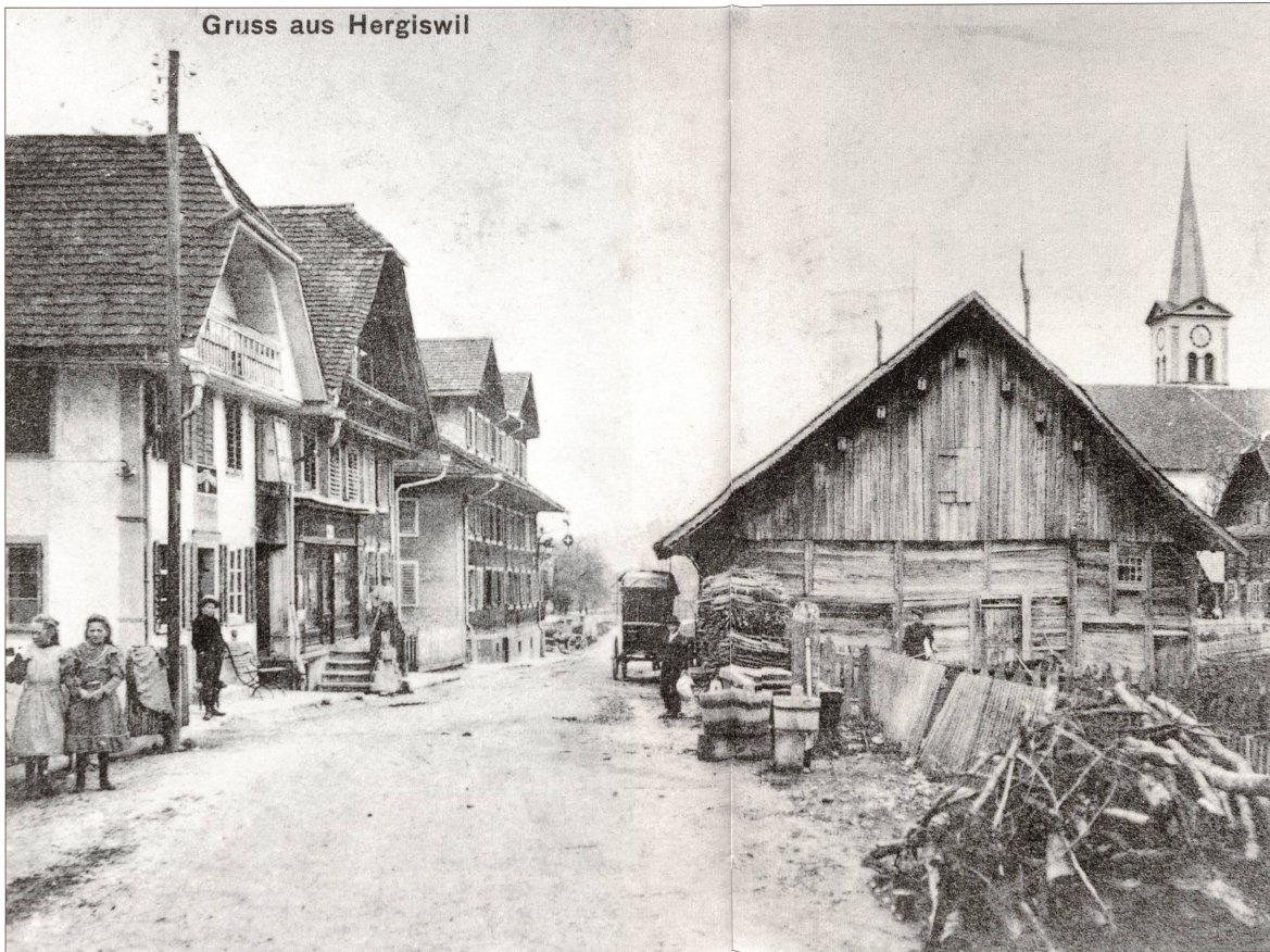
Gruss aus Hergiswil