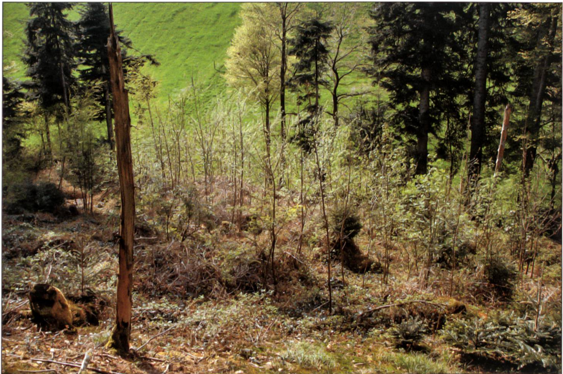
Abbildung 7: Naturverjüngung mit Bergaborn, Eschen, Buchen, Tannen, Fichten und diversen Straucharten auf einer Lotharfläche.