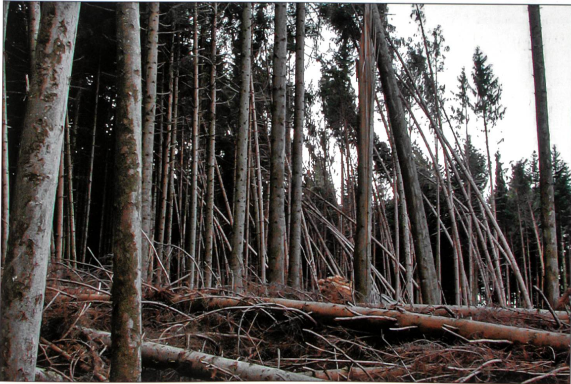
Abbildung 3: Ein vom Orkan Lothar geschädigter Wald, in dem mit Folgeschäden durch Borkenkäfer mit grosser Wahrscheinlichkeit zu rechnen ist.

tone Nidwalden, Freiburg und Bern am stärksten. Dies sind gleichzeitig auch die Regionen mit den grössten Holzvorräten von rund 450 Kubikmetern pro Hektare 3 , was dazu beitrug, dass hier die Schadholzmenge entsprechend gross war.