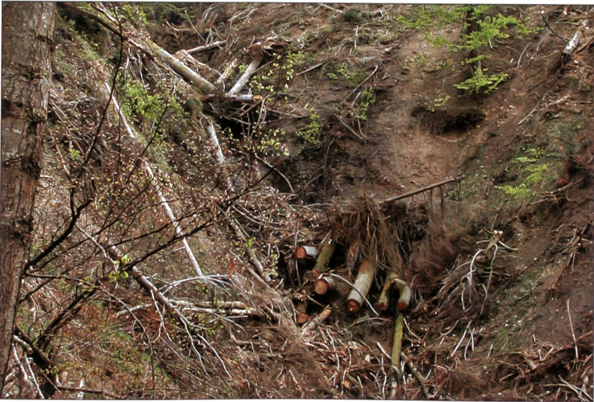
Abbildung 5: Entfernte Baumstämme in einem Graben im Lutherntal.

Fichten rechtzeitig aufgerüstet werden, bevor sich der Borkenkäfer unter ihrer Rinde vermehren kann. Viele stehende Fichten sind zudem im Wurzelbereich beschädigt oder vom Sturm geschwächt. Sie bieten dem Borkenkäfer ein üppiges Frassangebot und ideale Bedingungen zur Vermehrung. Dadurch entwickeln sich die Borkenkäfer massenhaft und bringen selbst gesunde Fichten mit ihrem Frass unter der Rinde zum Absterben. Die Folge ist ein markanter Anstieg an anfallendem Käferholz über mehrere Jahre (vgl. Abbildung 4).