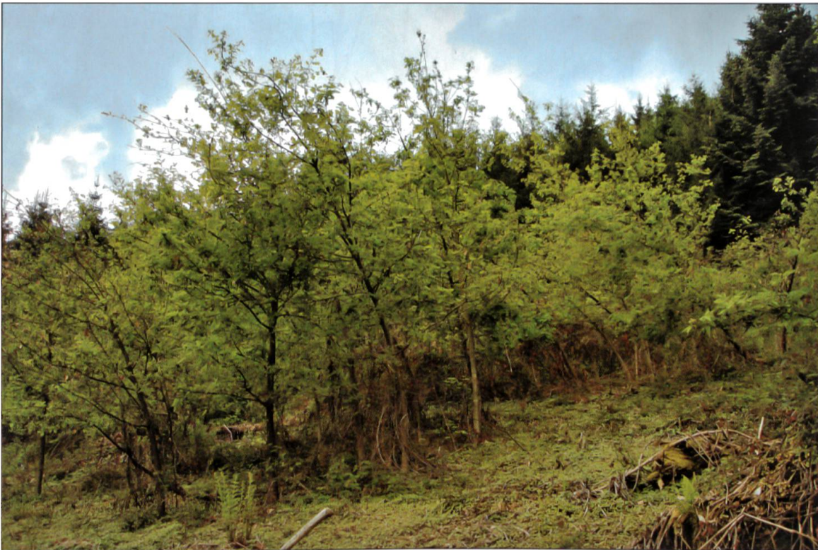
Abbildung 10: Ein von Nassschnee beschädigtes Nest von Eichenpflanzen. Nur die unteren stärkeren Individuen konnten der Last standhalten.

urteilt werden. Sie half jedenfalls die Wiederbewaldung ökonomisch sinnvoll zu bewältigen und war angesichts der grossen Schadflächen ein Gebot der Stunde.