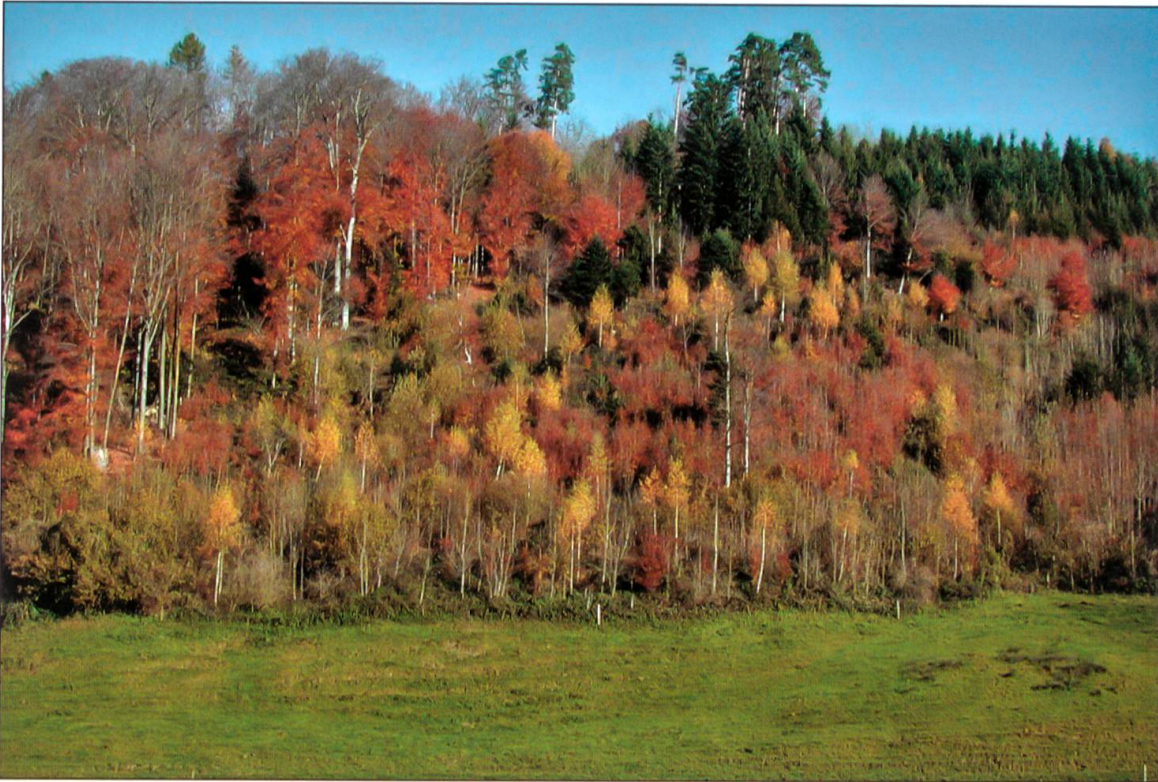
Abbildung 6: Standortgerechter Mischwald.