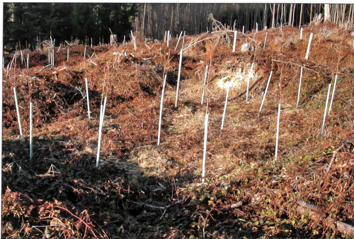
Abbildung 9: Frisch gepflanztes Bergaborn-Nest mit Wildschutz aus Plastik inmitten eines dichten Brombeerteppichs, zahlreichen Asthaufen und umgestürzten Wurzeltellern.