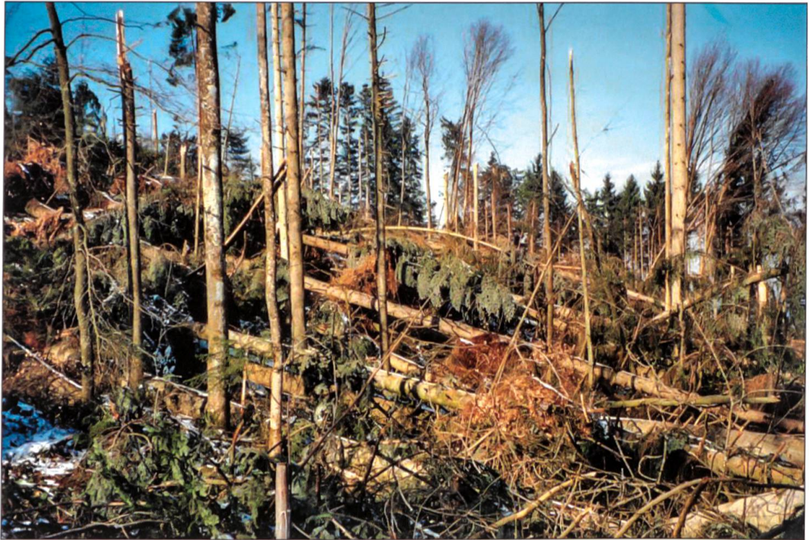
Abbildung 1: Schadensbild einer Lotharfläche.