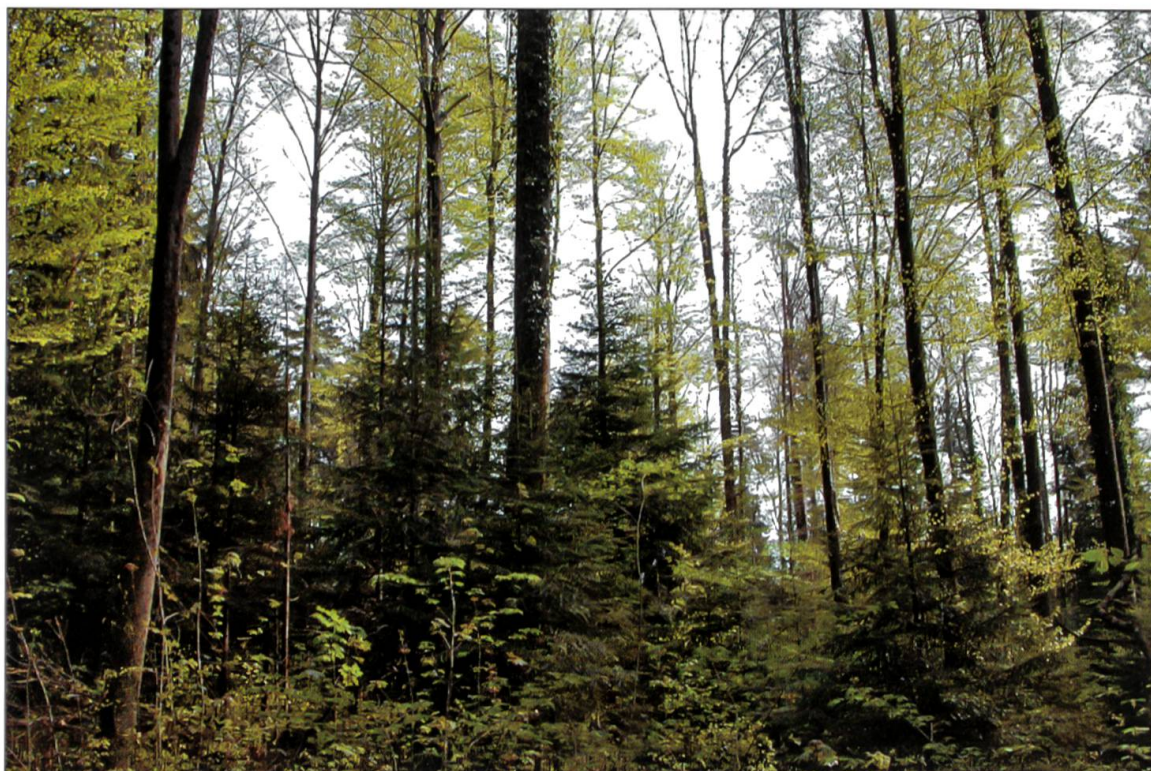
Abbildung 11: Angestrebter Waldzustand: An den Standort angepasster, stufiger Mischwald.

Der Kanton Luzern fördert zusammen mit dem Bund auch weiterhin die Pflege standortgerechter Jungwälder mit Beiträgen im Sinne von Finanzhilfen.