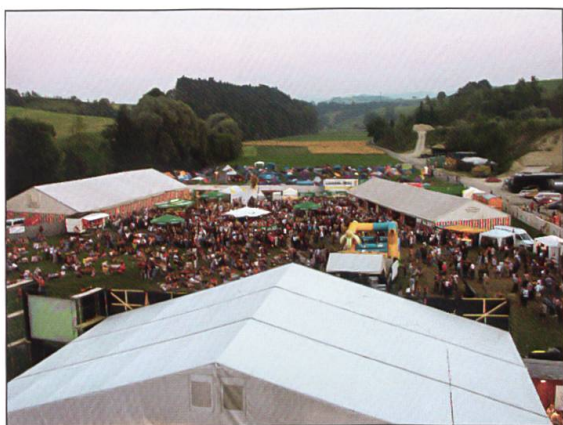
Das Festivalgelände 2002 aus der Vogelperspektive mit einer grossen Menschenmenge im Innern.