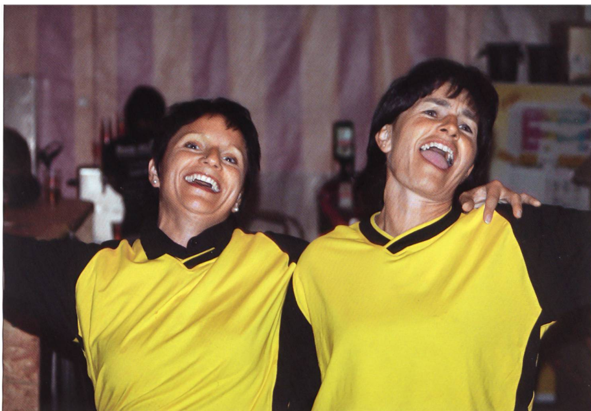
Fröhlich gestimmte Helfer trifft man an allen Ecken des OpenQuers. Bis zu 300 Freiwillige leisten jährlich ihren Beitrag zum Gelingen des Festivals.