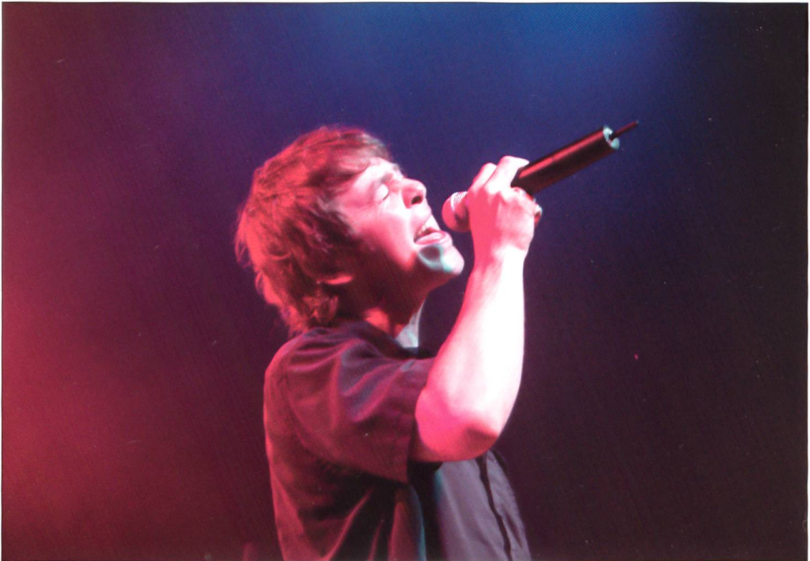
Die deutsche Pop-Band Fools Garden mit ihrem Sänger Peter Freudentaler sorgte 2005 für prächtige Stimmung.