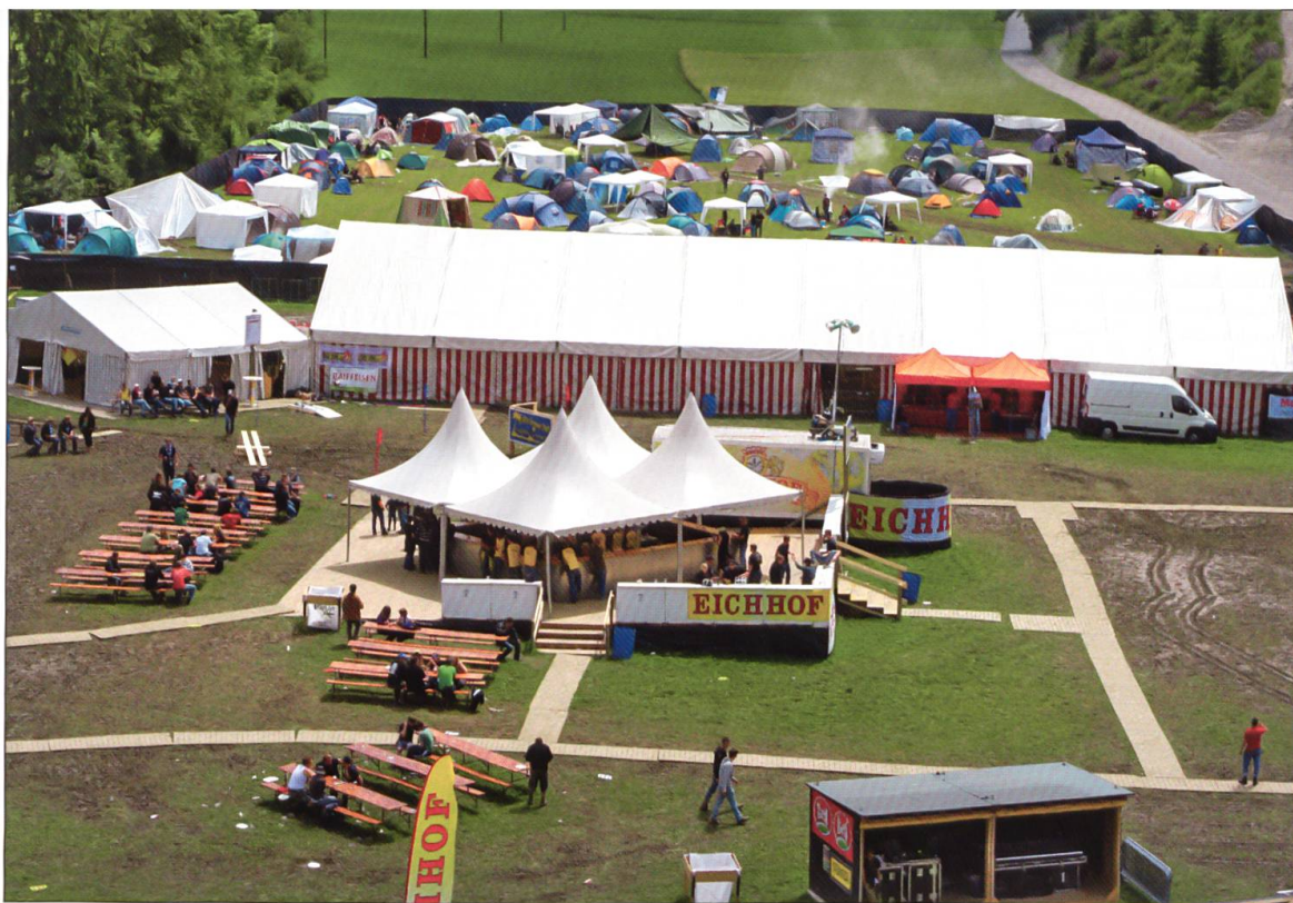
Ein mit Schlamm durchzogenes Gelände im Jahre 2009. Leider kein seltenes Bild in diesen Jahren.