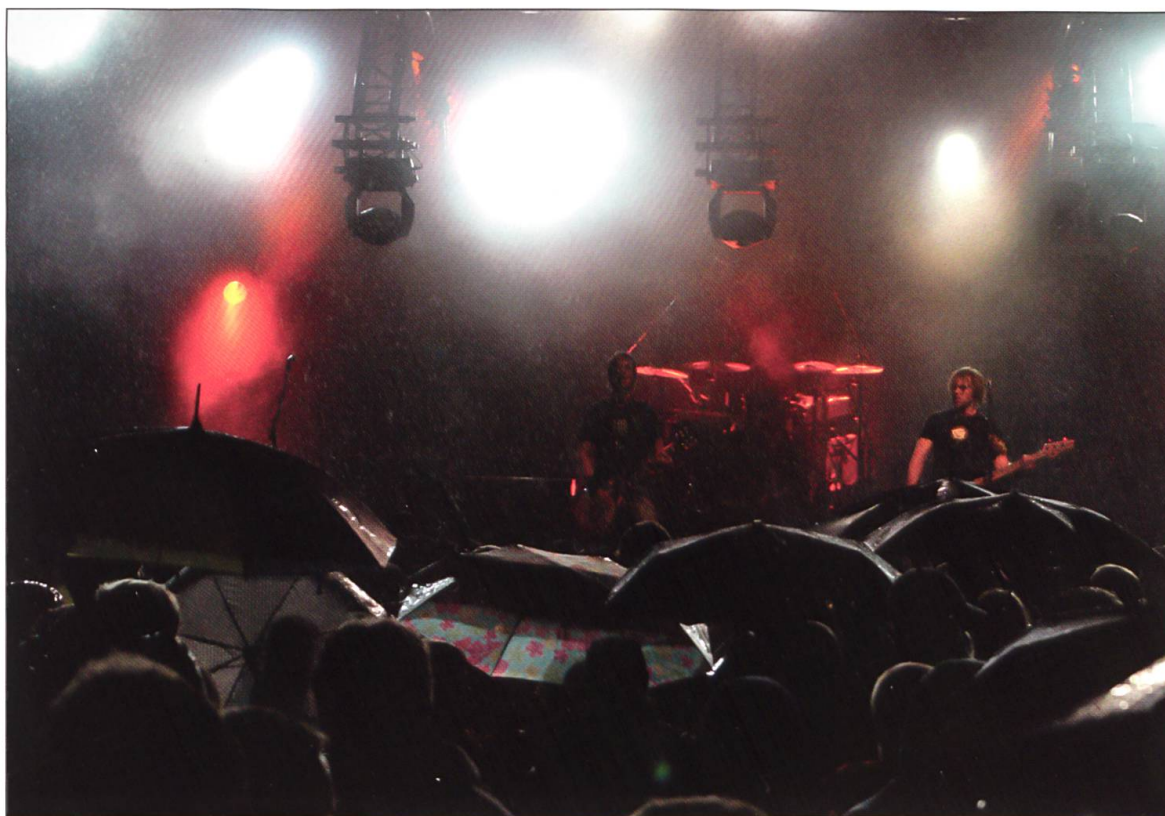
Selbst heftiger Regen konnte 2004 viele Besucher nicht davon abhalten, die einheimische Band Vivian vor der Bühne zu unterstützen.