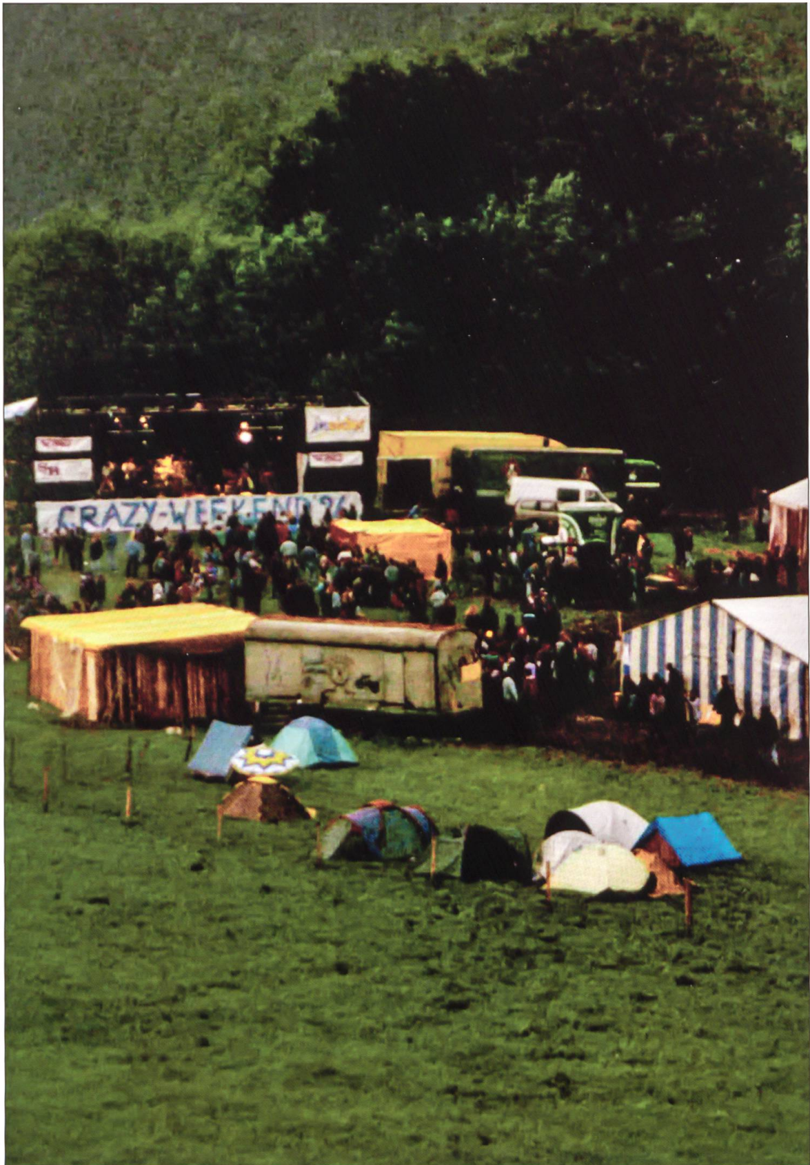
„Crazy-Weekend 96“ steht auf dem Banner vor der Bühne, und so dürfte auch die Party 1996 auf dem noch kleinen Gelände 1996 abgelaufen sein.