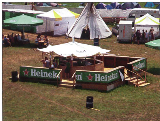
Die äusserst beliebte Bierinsel war 2002 noch sehr klein und wurde im Verlauf der Jahre immer grösser.

der von Merciless brachten ebenfalls von musikalischer Seite her viel Wissen mit, und das Jugend-Team habe sich mit der vorhandenen Infrastruktur hervorragend für die Betreuung der Korrespondenz geeignet. Die Mischung stimmte, die Zusammenarbeit fruchtete, die Fokussierung auf einheimische Bands zahlte sich aus. Das erste Rock- und Bikerfest in der Kiesgrube in Zell war ein voller Erfolg: «Es kamen rund dreimal mehr Leute als die erwarteten 500 Zuschauer auf das Gelände», erzählt der gebürtige Zeller.