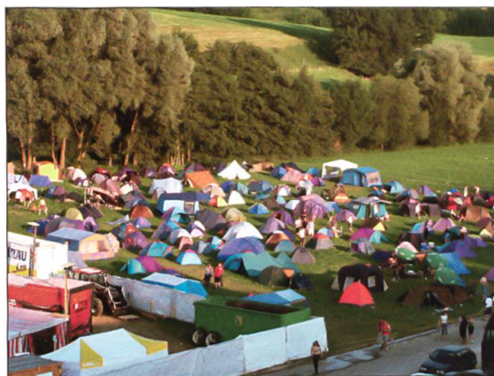
Viele Besucher nutzten in all den Jahren den Zeltplatz des OpenQuers, so auch 2002.

unterschätzt und bedauern dies sehr.» Trotzdem hält er den Entscheid des Strategiewechsels immer noch für richtig, ergänzt aber: «Wenn man am Rock- und Bikerfest in seiner ursprünglichen Form festgehalten hätte, könnte man an der Stelle des internationalen Bikertreffs in Sumiswald stehen, wo Jahr für Jahr Tausende Biker aus ganz Europa feiern.» Dieser Weg wäre damals aber finanziell kaum zu bewältigen gewesen. So ging das Festival den Weg einer Mischung aus einheimischen und ausländischen Bands, aus Rock- und Partymusik, aus Feiern und sich Feiernlassen. Eine Mischung, die schliesslich zum Markenzeichen des OpenQuers wurde.