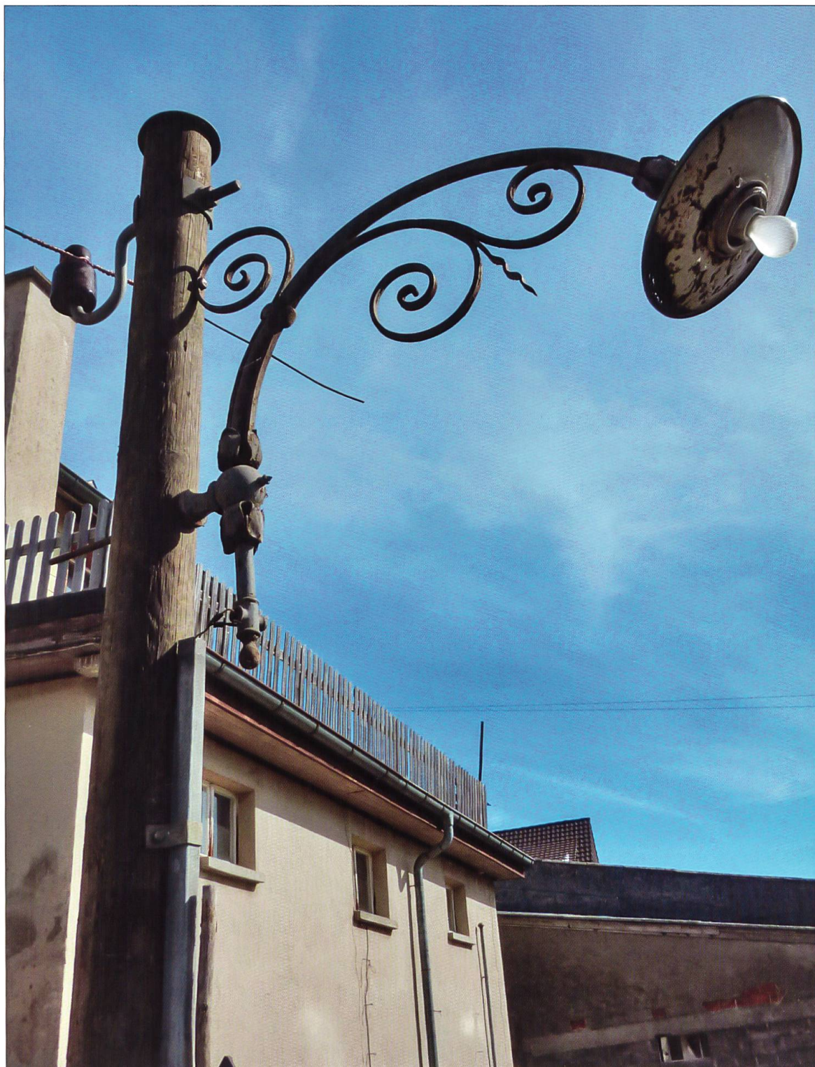
Eine der ersten Strassenlampen Ufhusens.

und den Verlockungen der interessanten Angebote unterlag bisher keine Genossenschaft. Alle möchten den Strom-