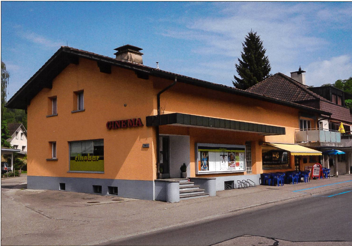
Das Kino Mohren in Willisau, Mai 2015.