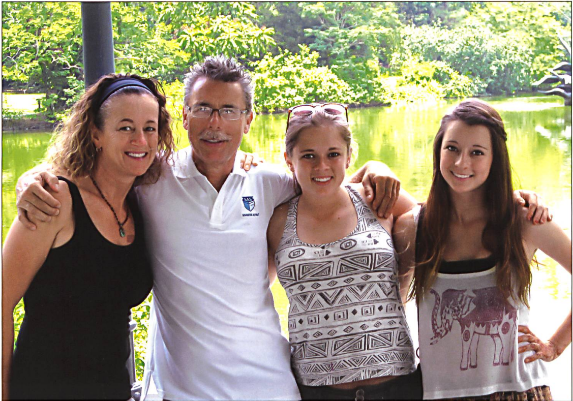
Familie Schwegler umsegelt 2012 die Welt und macht Halt in Singapur.