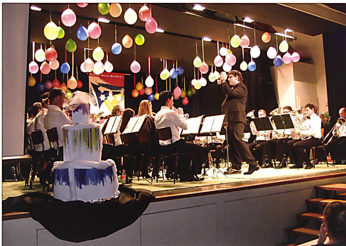
Brass Band Schötz.

folgenden, kurzen Vereinsvorstellungen – kann zu wunderbaren, musikalischen Höchstleitungen führen.