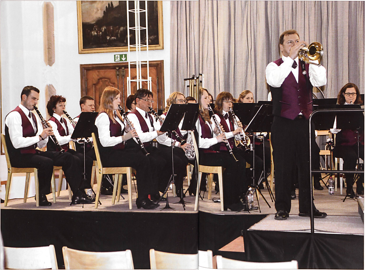
Die Musikgesellschaft Sankt Urban spielt im Festsaal des ehemaligen Klosters Sankt Urban.