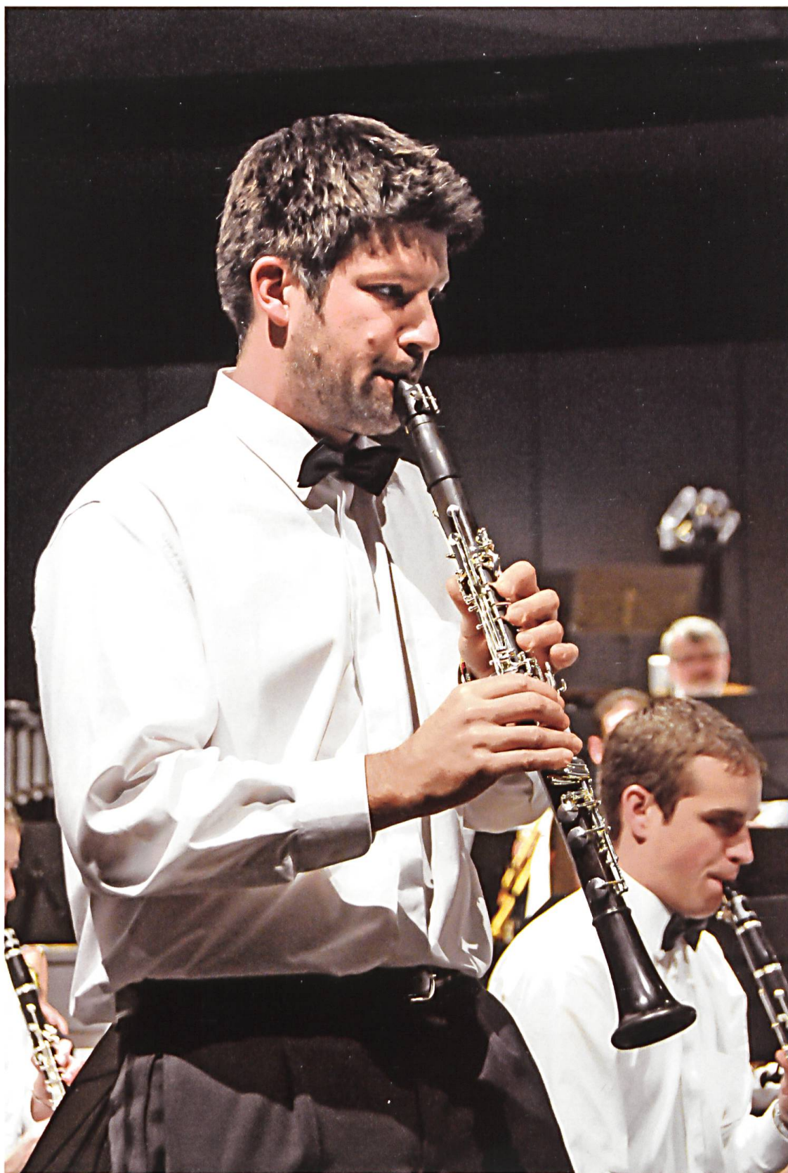
Feldmusik Willisau im Jahr 2016.