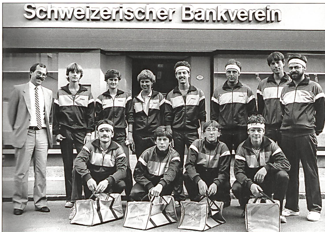
Die Aktiven des TTC Willisau mit neuem Hauptsponsor 1985.