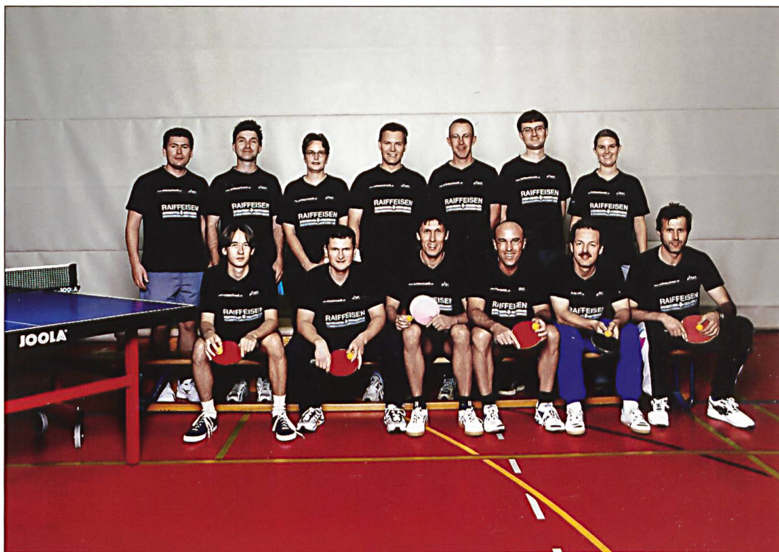
Die Aktiven des TTC Willisau im Jahr 2000...