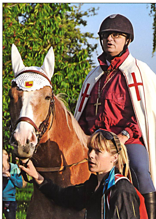
Rechts: Bischof Felix Gmür als Festprediger hoch zu Pferd beim Grosswanger Umritt 2017.