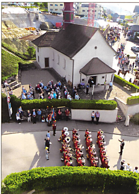
Links: Gottesdienst vor der Wendelinskapelle Wauwil mit Musikgesellschaft.