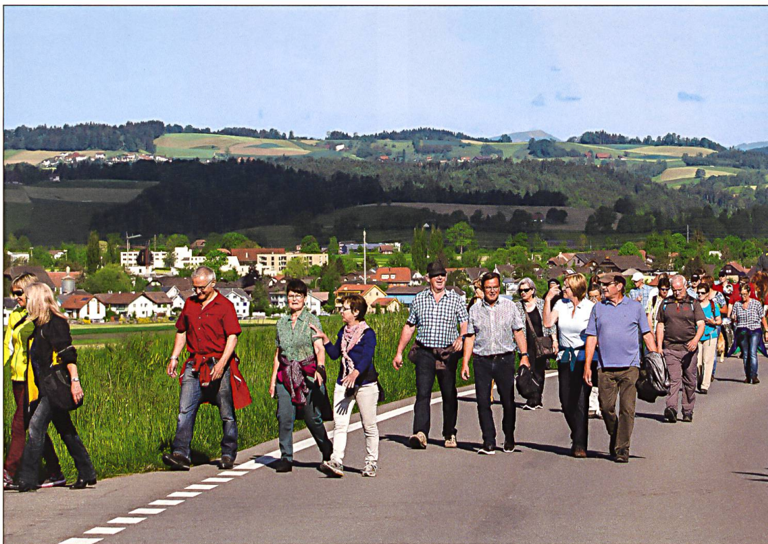
In Gottes Schöpfung durch Feld und Flur bei der Ettiswiler Umrittsprozession.