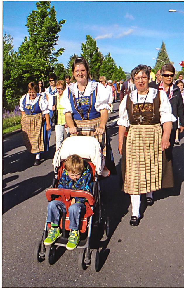
Links: Traditioneller Segensaltar vor einem Bauerngehöft beim Unter-Wellbrig, Schötz. Rechts: Trachtenleute und Eltern mit Kleinkindern beim Altishofer Umritt.

Menschen jedes Jahr wieder treu die Tradition des Umritts pflegen und lebendig erhalten, sei es zu Fuss oder zu Pferd. Dazu tragen auch viele Gäste von auswärts bei, Delegationen von Reitvereinen, die Kirchenräte, Pfarrräte, die Kapellenpfleger und auch die Festprediger. Ihnen und allen, die bei der Vorbereitung und Durchführung mitwirken, sei an dieser Stelle ganz herzlich gedankt.