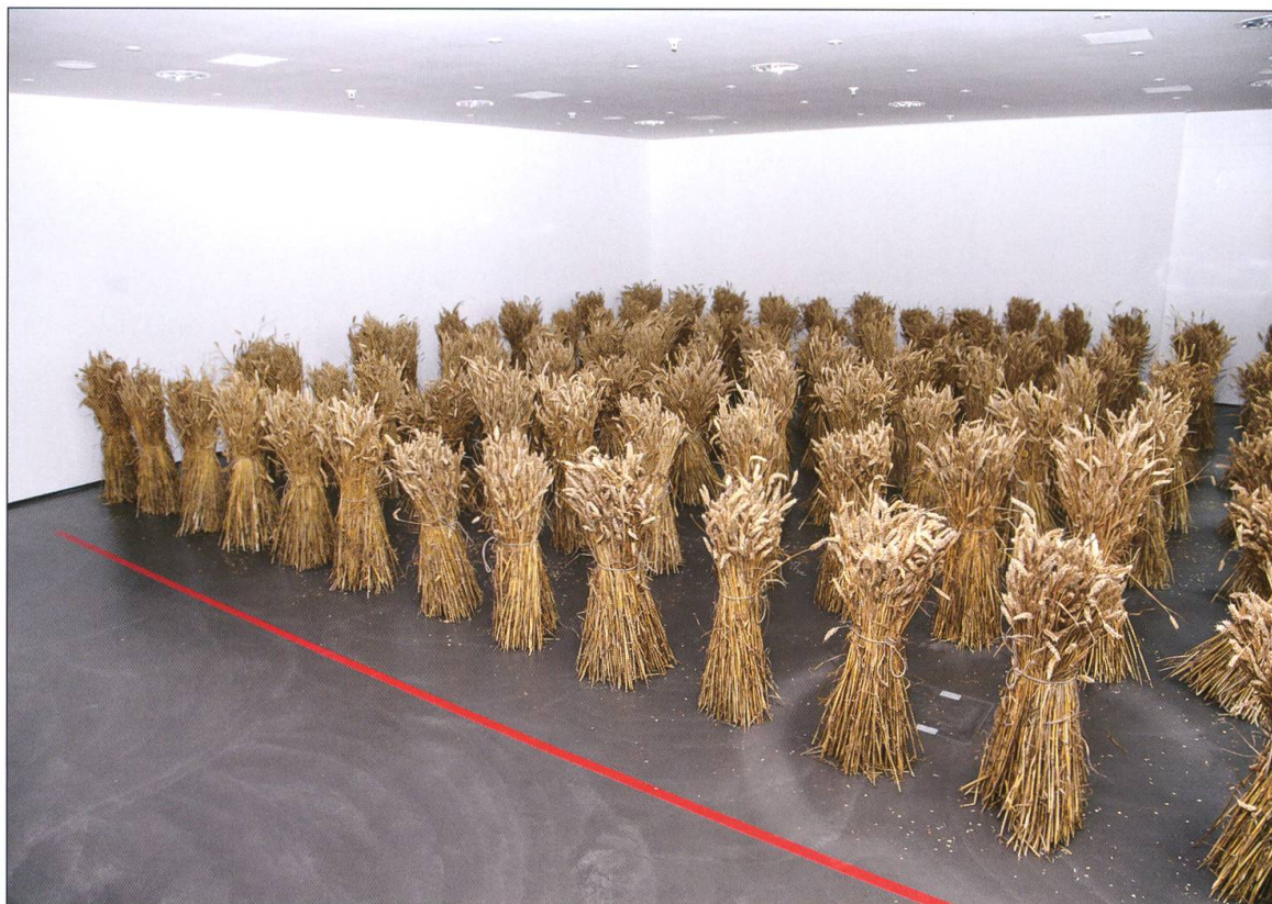
Mahlerei 2012, Stadtmühle Willisau.