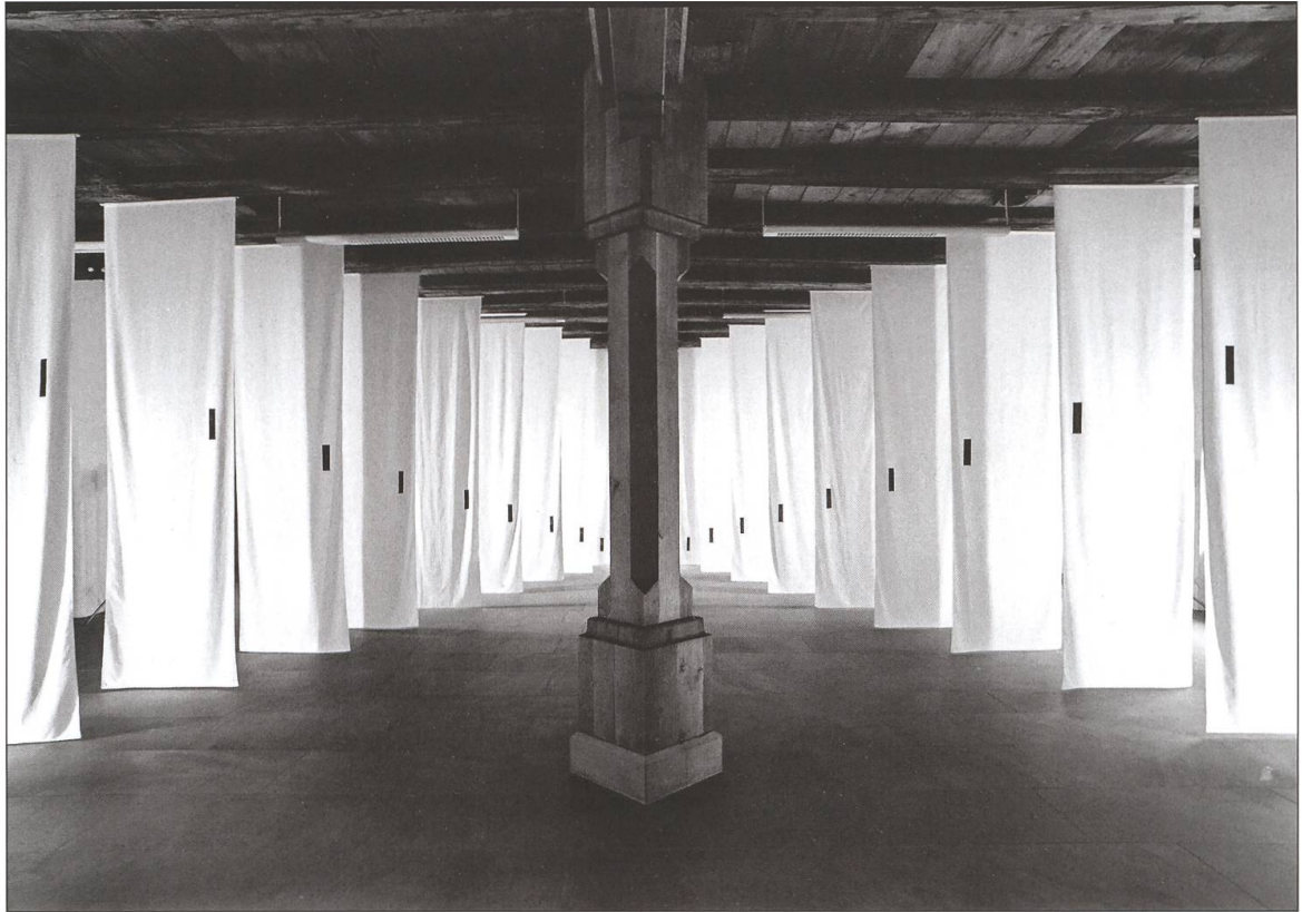
Schwellen des Schweigens 1994, Rathaus Willisau.