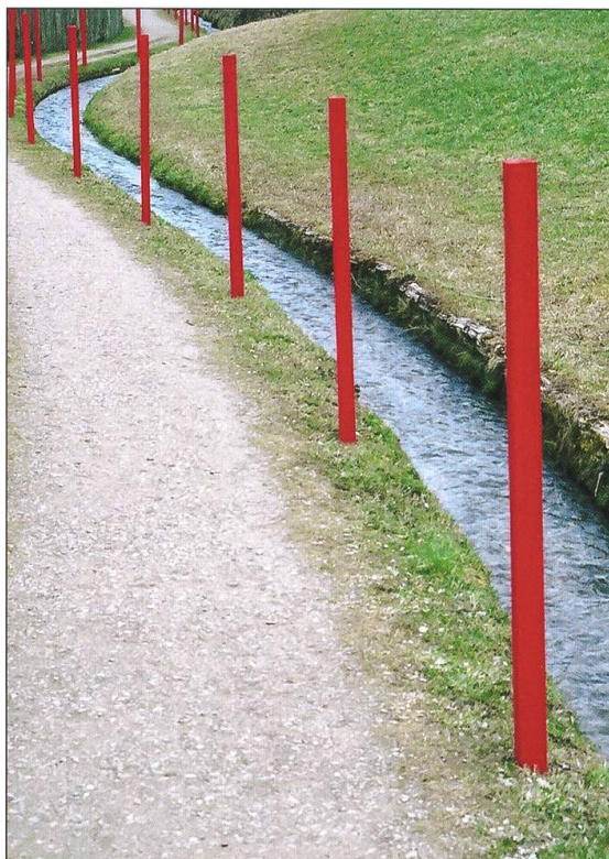
Grenzerfahrungen 1, 2003, Willisau.