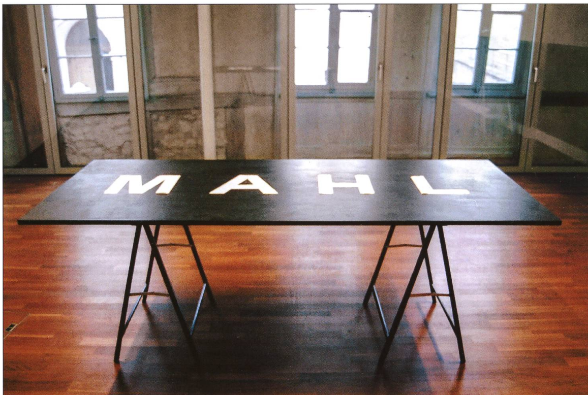
Mabl 2004, Stadtmühle Willisau.

nung. Mit fünfundzwanzig strikt ausgerichteten Säulen aus je vier gestapelten Fässern fand die ehemalige Turbinenhalle zur Konzentration. Ermöglicht wurde dies mit einer Gönneraktion, dank der die Fässer nach der Ausstellung Plätze bei Kunstliebhabern und Sammlern fanden. Edwin Grüters Werk wird in diesen Erinnerungsstücken und natürlich im Buch weiterwirken. Auf seine nächsten Interventionen darf man gespannt sein.