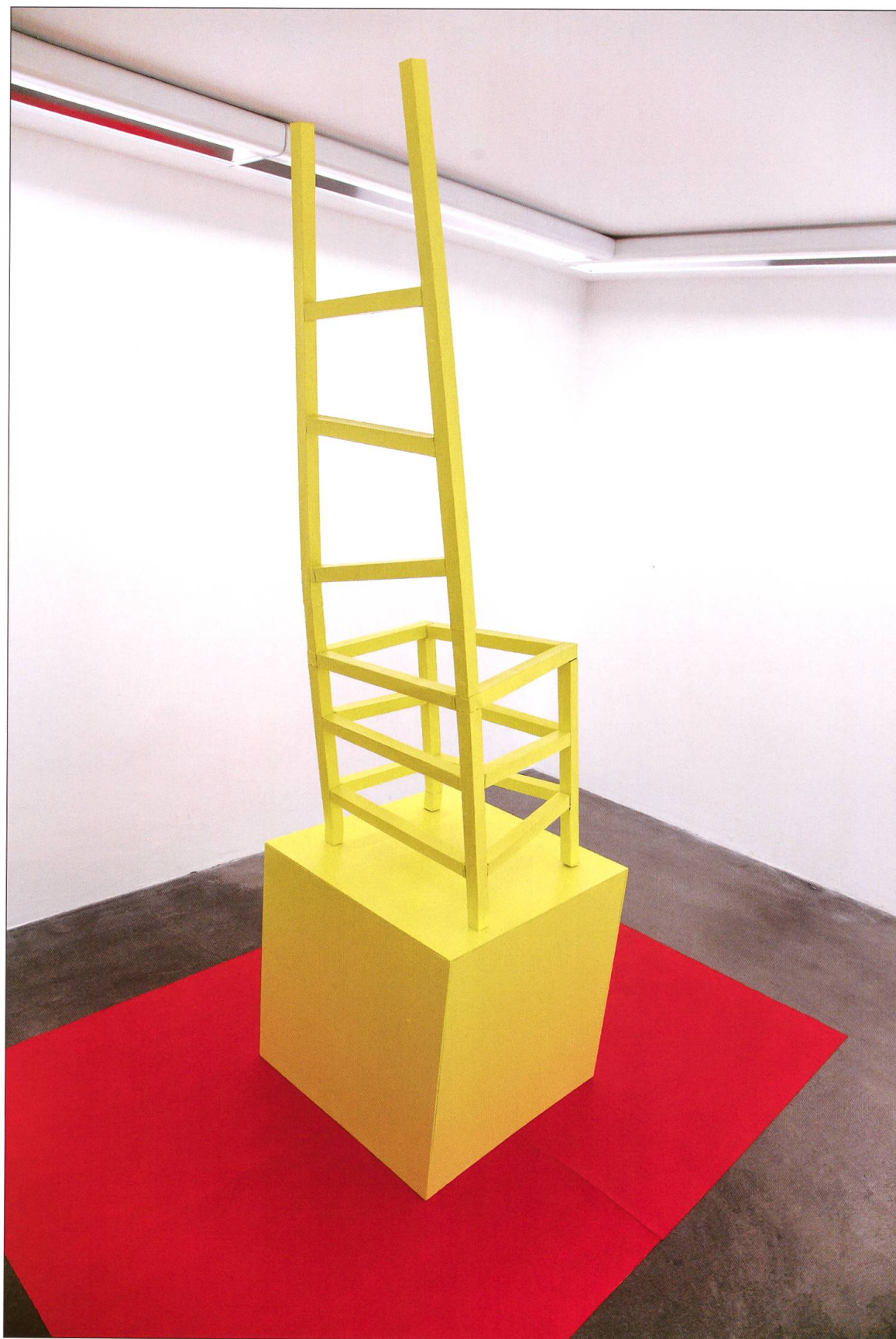
Beleerungen 2016, Galerie Kriens.