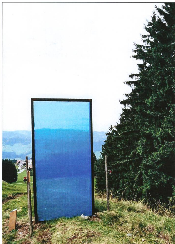
BildStock 2000, Heiligkreuz.