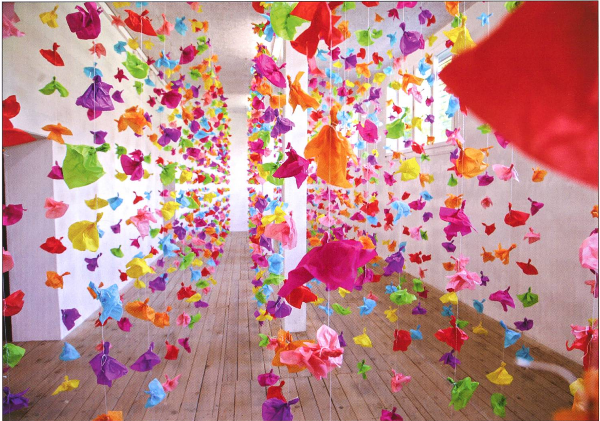
Hängende Gärten 2016, KKL Beromünster.

schutznetze, deren Stabilität, Transparenz und Farbigkeit sich für Interventionen im Freien anbieten. So hat der Künstler für die Ausstellung «bild-STOCK» auf Heiligkreuz ein rotes, ein blaues und ein gelbes Netz in Rahmen gespannt und so in der Landschaft platziert, dass sich kunstvoll verfremdete Durchblicke ergaben. Durch das Verdecken wurde die Landschaft neu sichtbar.