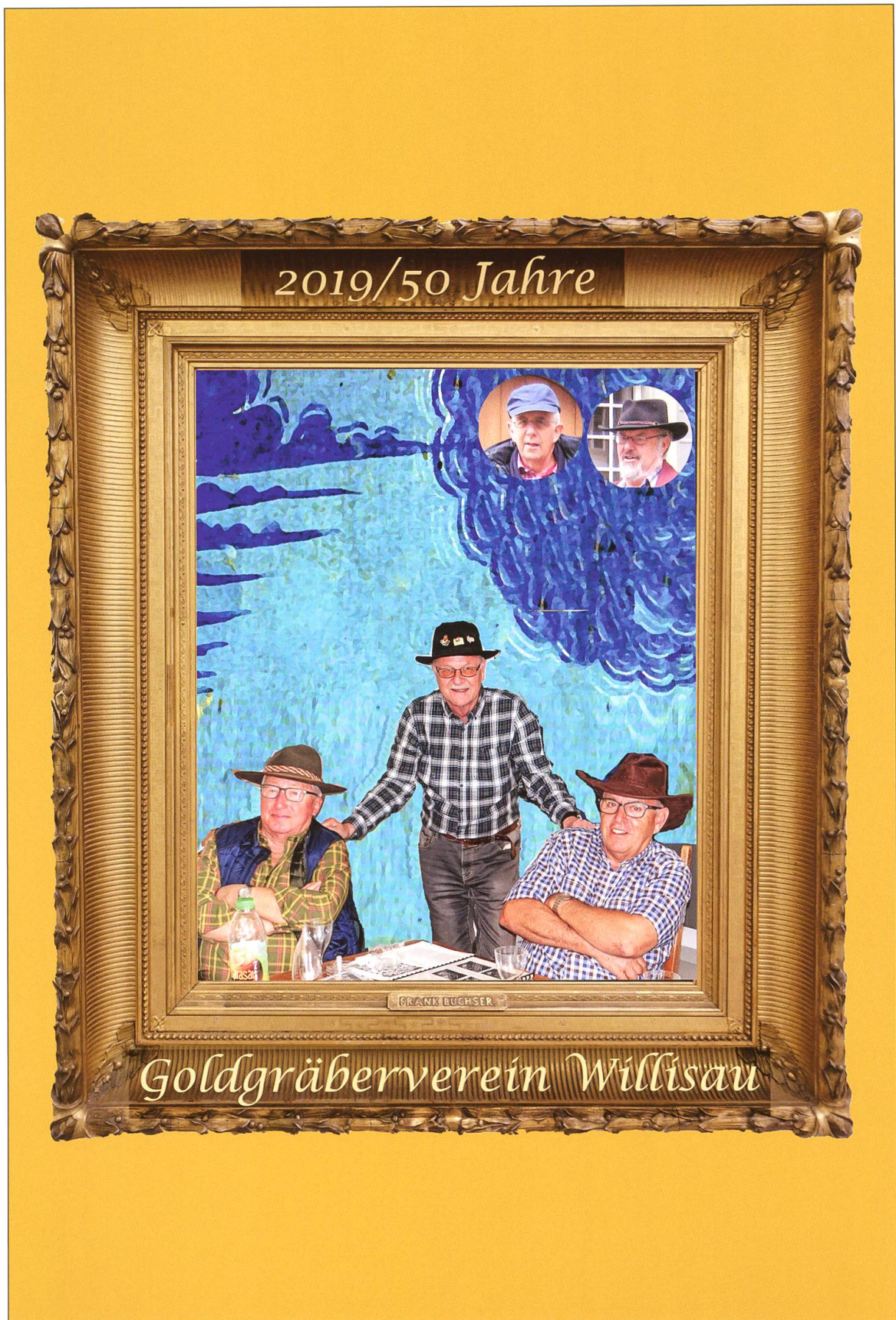
Jubiläumsbild (Fotomontage) zu «50 Jahre Goldgräberverein Willisau».