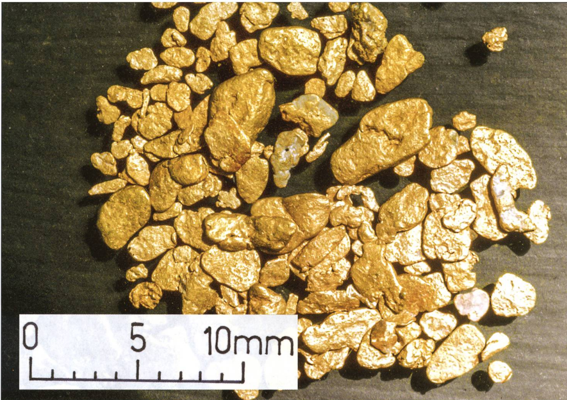
Grössere Exemplare echter Napfgoldflitterchen, die aus der Grossen Fontanne stammen.

Im 18. Jahrhundert erreichte die Goldwäscherei im Kanton Luzern ihren Höhepunkt. Von 1700 bis 1740 wurden dem Staat Luzern insgesamt neun Kilogramm Waschgold abgeliefert.