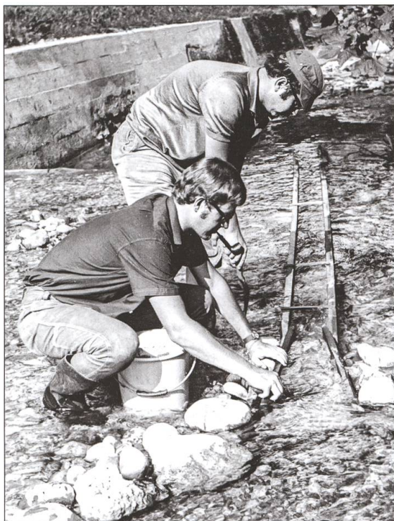
Zwei Willisauer Goldgräber an der Arbeit in der Grossen Fontanne mit dem selbstgebastelten Waschkännel.