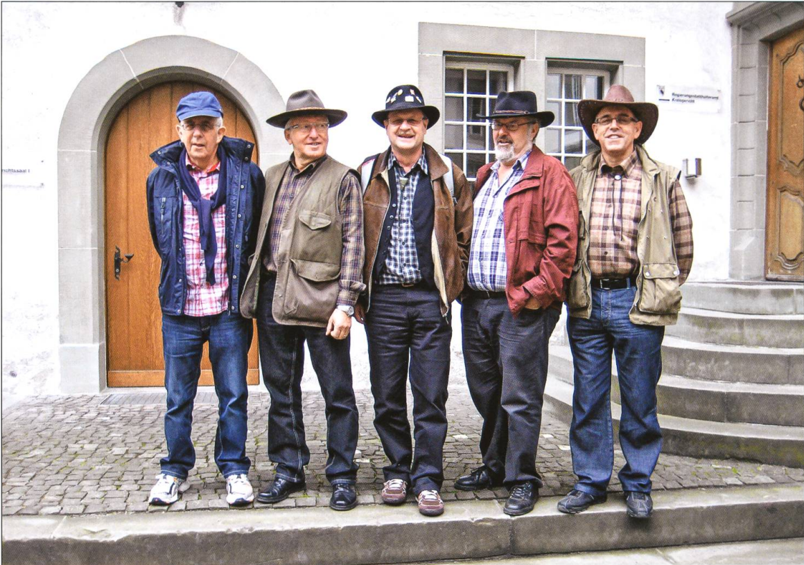
Die fünf Goldgräber vor dem Schloss Burgdorf beim Besuch des Schweizerischen Goldmuseums anlässlich des 40-Jahr-Jubiläums.