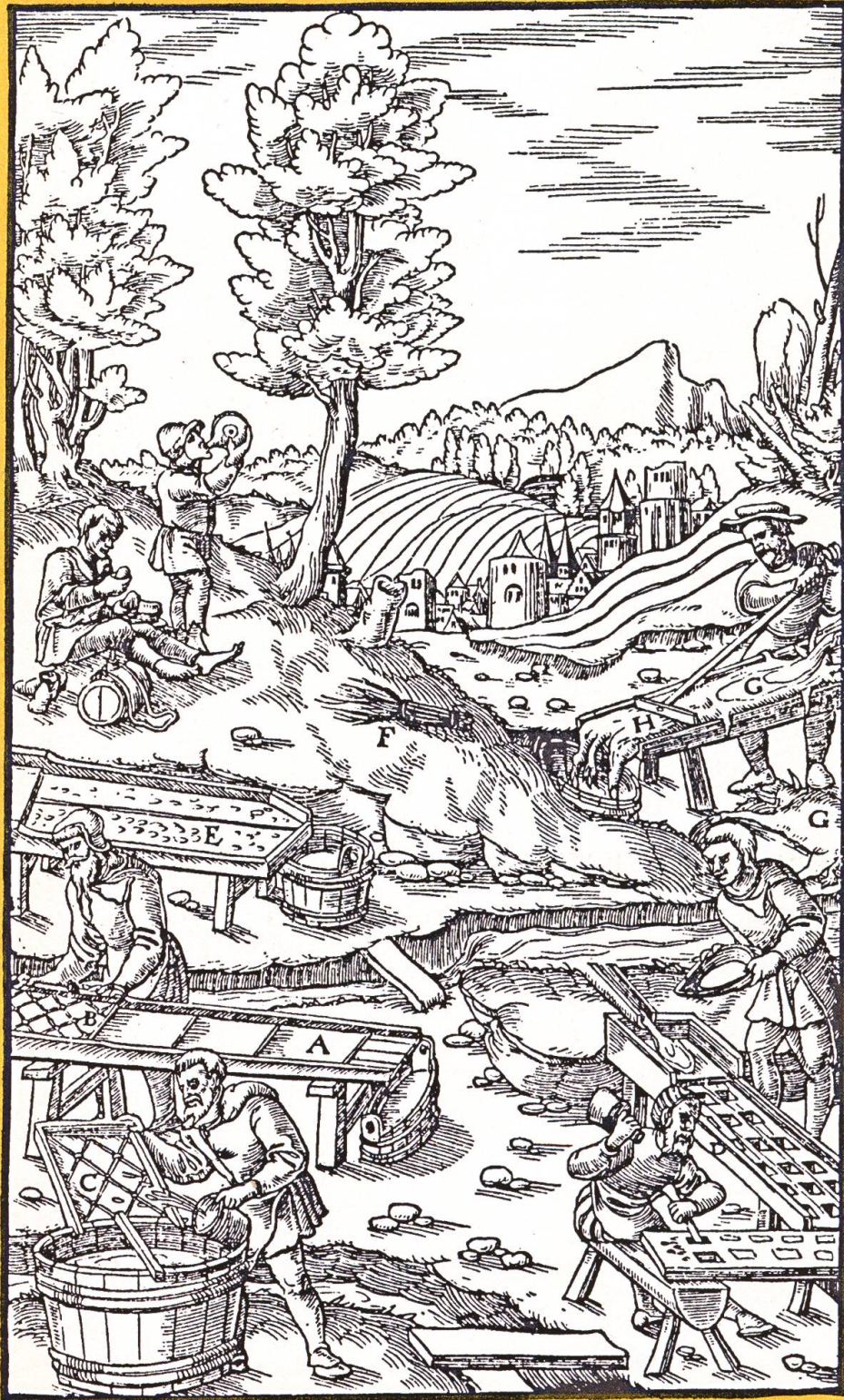
Der Planenherd A. Sein Haupt mit Vertiefungen und Rillen B. Das abgenommene Haupt wird in einem Fasse gewaschen C. Der Herd mit rechteckigen Vertiefungen D. Ein Herd, an dessen Brettern kleine Flitterchen hängenbleiben E. Besen F. Stierhäute G. Die Kiste H.