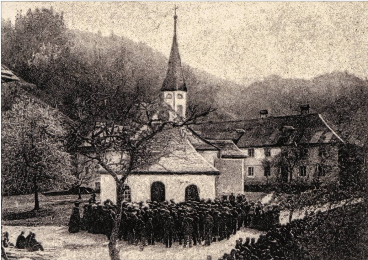
Luthern Bad, Wallfahrtskapelle mit Pilgern, Ausschnitt aus Postkarte Gruss aus Luthern, Poststempel Luthern, 24.06.1904.