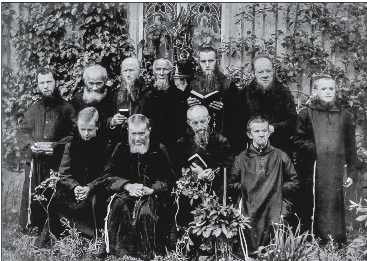
Waldbrüder Luthern Bad 1893.

Ihre handwerklichen Tätigkeiten führten sie in einem Ökonomiegebäude aus, das an das Kloster angebaut worden war.