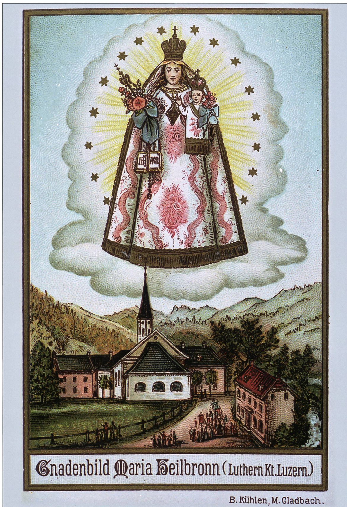
Luthern Bad, Gnadenbild Maria Heilbronn um 1900 von B. Kühlen, Farblitho, Marienerscheinung.