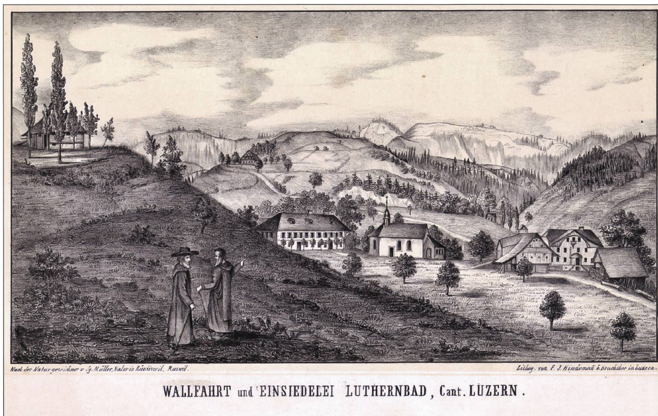
Luthern Bad und Waldbrüder, Lithografie Müller-Hindemann 1846, Original 33,8 mal 18,4 Zentimeter, Napf abgeholzt.

waren sie angehalten, «Disziplin» zu machen, zum Beispiel mit dem langsamen Beten des Psalms «Miserere». Die Absicht bei der Disziplin sei stets «die Abtötung des Leibes, daher Unterdrückung und Schwächung der Begierlichkeiten und die Verehrung des gegeisselten und ganz zerfleischten Gottessohnes.»