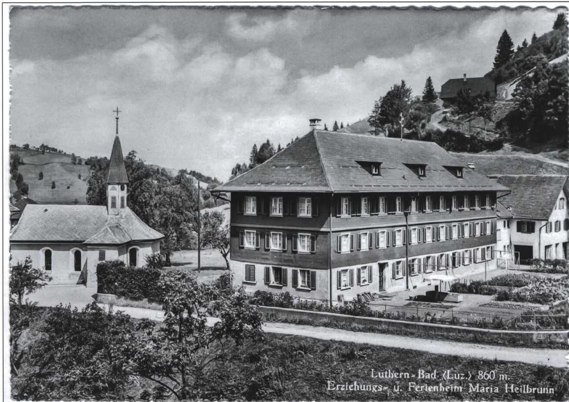
Luthern Bad, Postkarte mit Erziehungs- und Ferienheim Maria Heilbrunn.

Poststempel Luthern Bad, 07.06.1950.