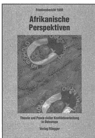
Friedensberichte Hrsg.: ÖFSK Stadtschlaining / SFS Bern in Zusammenarbeit mit AFK Bonn